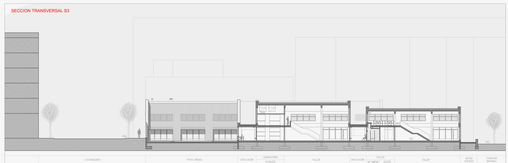
SECCION TRANSVERSAL S3

C/ONDURES PATIO UNIDAD CIRCULACIÓN LABORATORIO ALMACÉN TALLER CIRCULACIÓN TALLER VC UNIDAD ACCESO TALLER ACCESO ALMACÉN PASSATGE BOFARULL