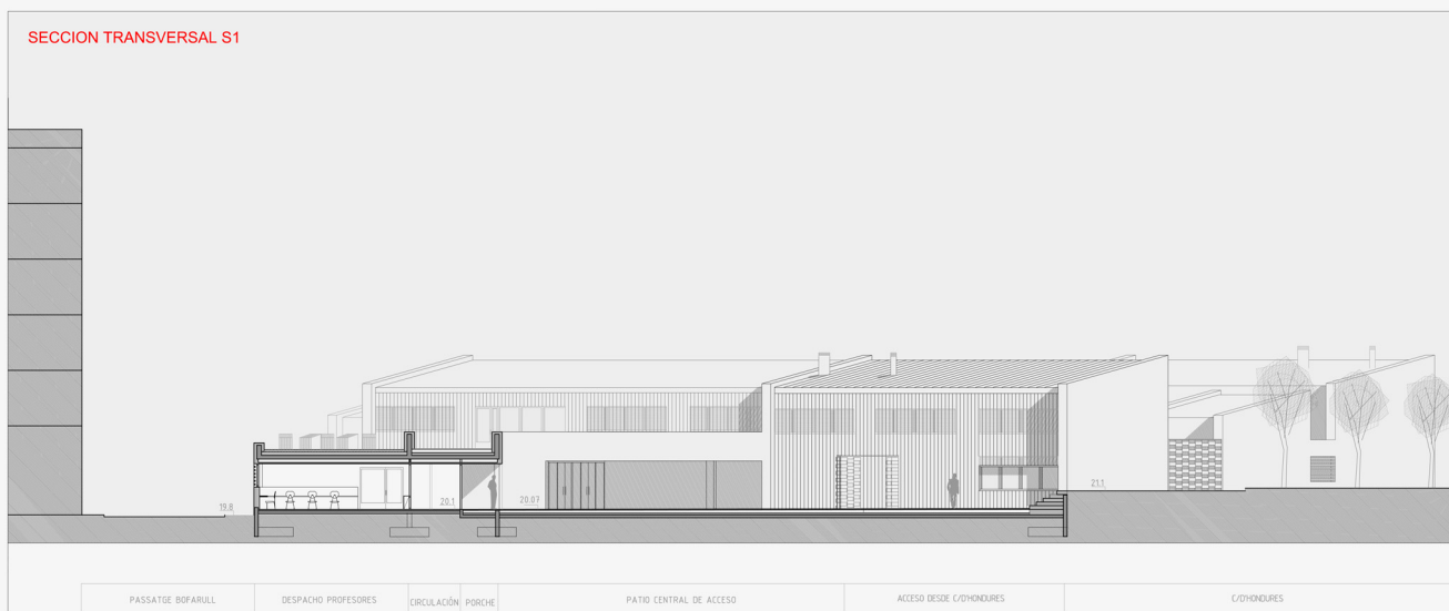
SECCION TRANSVERSAL S1

PASSATGE BOFARULL DESPACHO PROFESORES CIRCULACIÓN PORCHE PATIO CENTRAL DE ACCESO ACCESO DESDE C/ONDURES C/ONDURES