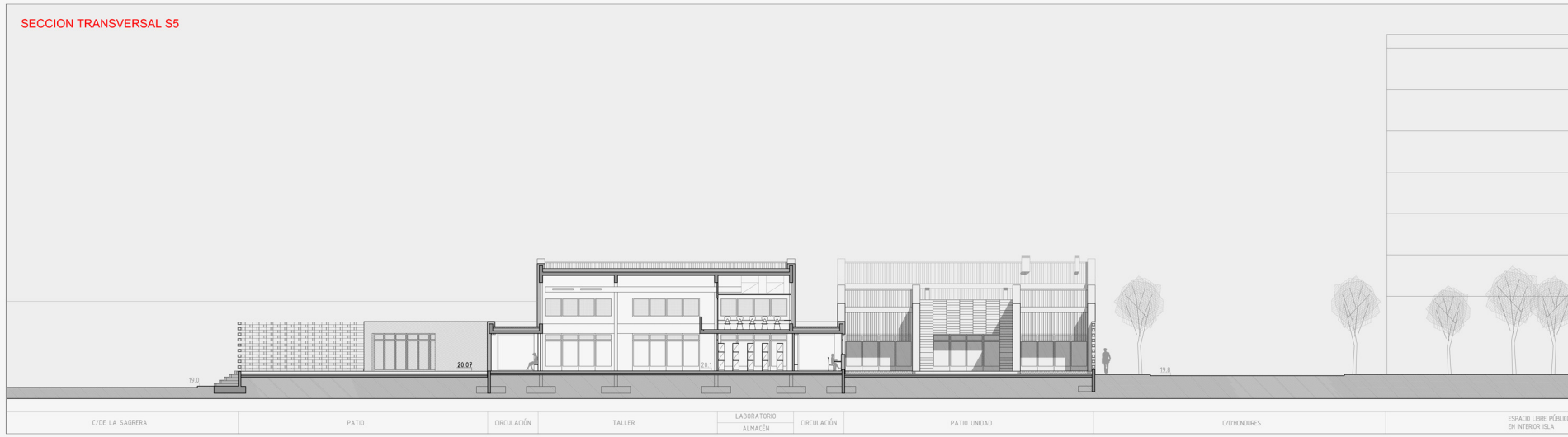
SECCION TRANSVERSAL S5

C/DE LA SAGRERA PATIO CIRCULACIÓN TALLER LABORATORIO ALMACÉN CIRCULACIÓN PATIO UNIDAD C/ONDURES ESPACIO LIBRE PÚBLICO EN INTERIOR SLA