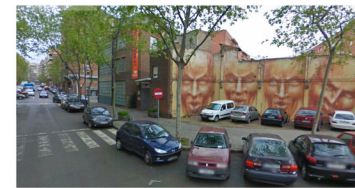
V1_C/D'HONDURES_ACCESO NAU IVANOV

EL SOLAR ACTUALMENTE ESTÁ PARCIALMENTE OCUPADO POR LA NAU-IVANOV Y OTROS EDIFICIOS EN MAL ESTADO DE CONSERVACIÓN. POR ELLO SE PROPONE UNA INTERVENCIÓN DE RENOVACIÓN URBANA EN LA CUAL EL PROYECTO AYUDA A CONSOLIDAR UN ENTORNO URBANO QUE ACTUALMENTE ESTÁ MUY FRAGMENTADO. PARA ELLO SE CONSERVARÁ LA NAU IVANOV, SÍMBOLO DE LA CULTURA EN EL BARRIO, Y SE DERIBARÁN EL RESTO DE EDIFICACIONES, LEVANTANDO POSTERIORMENTE UN NUEVO CENTRO QUE ESTÉ ESTRECHAMENTE LIGADO AL DESARROLLO DE LAS ARTES Y LA CULTURA.