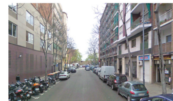
V5_C/JOSEP ESTIVILL_EJE VISUAL