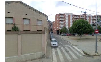
V3_C/SAGRERA CON PTGE BOFARULL ESPACIO LIBRE