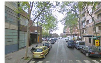
V4_C/D'HONDURES_ACCESO NAU IVANOV