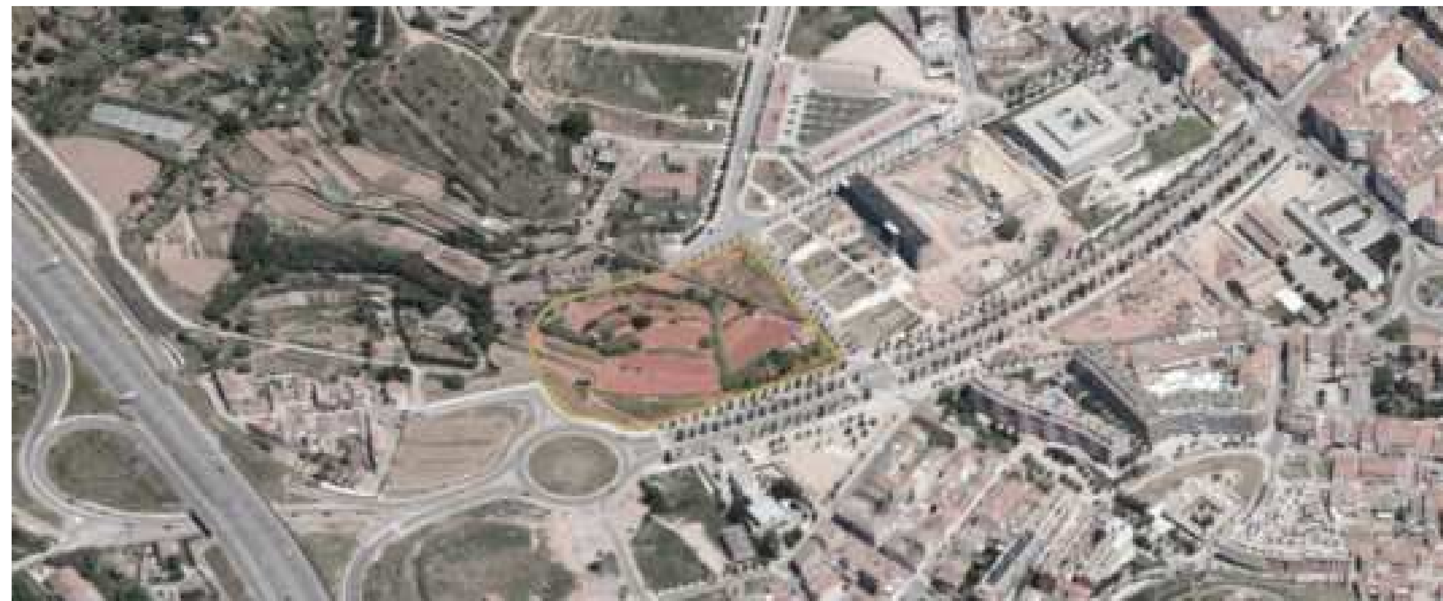
VISTA AÈRIA DE L'ENTORN DEL PROJECTE

El projecte es situa a l'anomenada porta de coneixement amb vinculació directa amb l'eix transversal C-25. Aquest fet permet l'accés des de qualsevol punt de la ciutat o des dels diversos nuclis rurals de Bages.