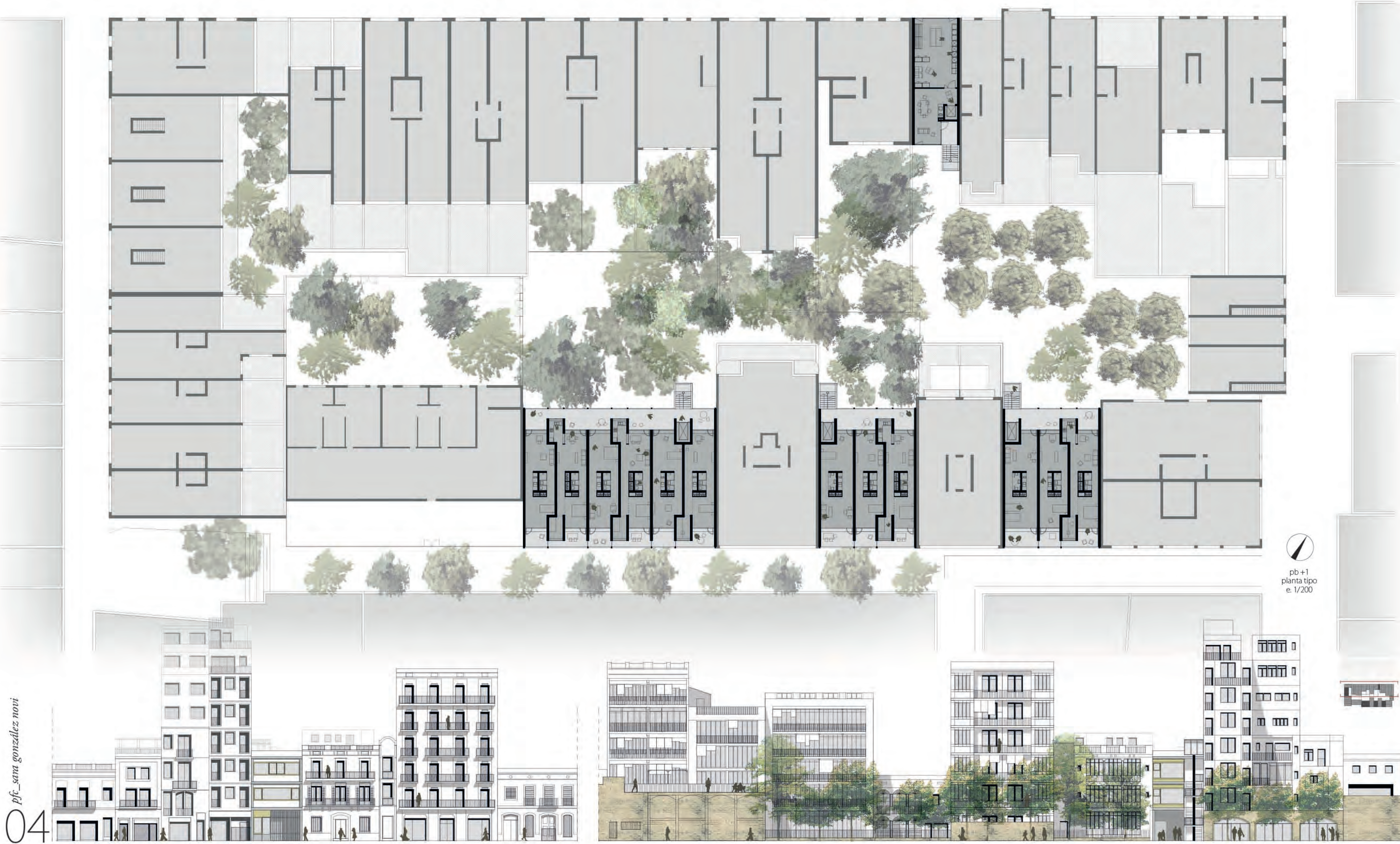
alzado interior e. 1/200