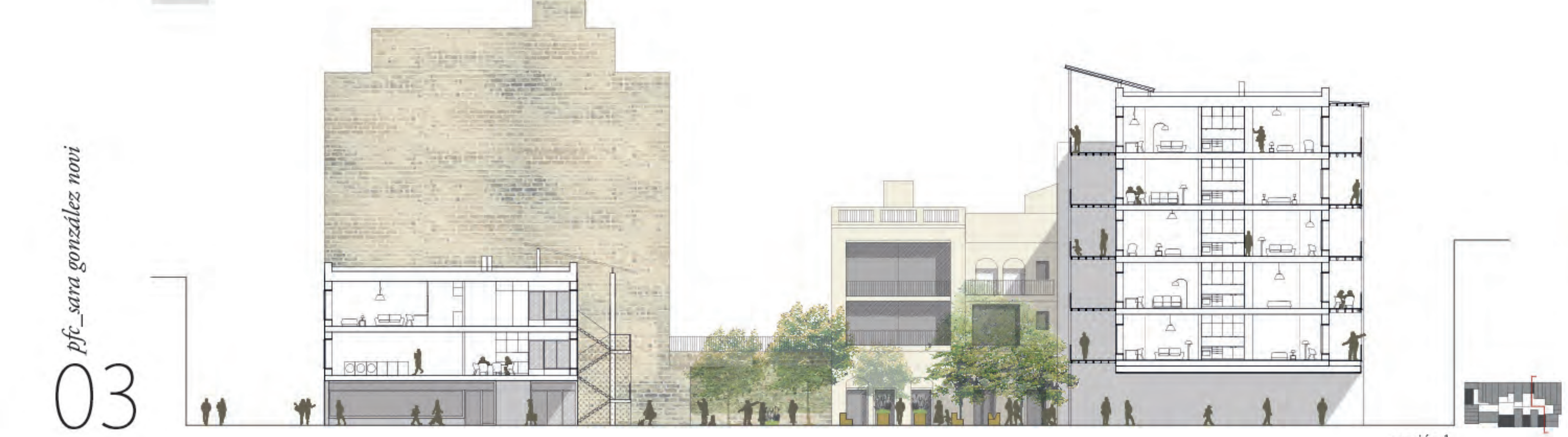
sección 1 e. 1/200