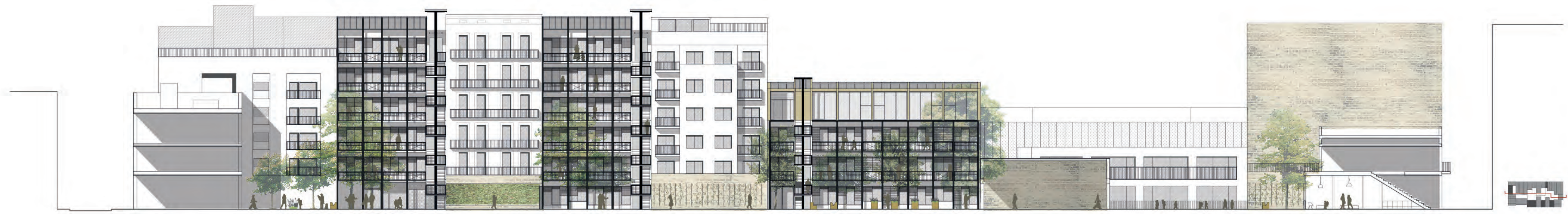
alzado interior e. 1/200