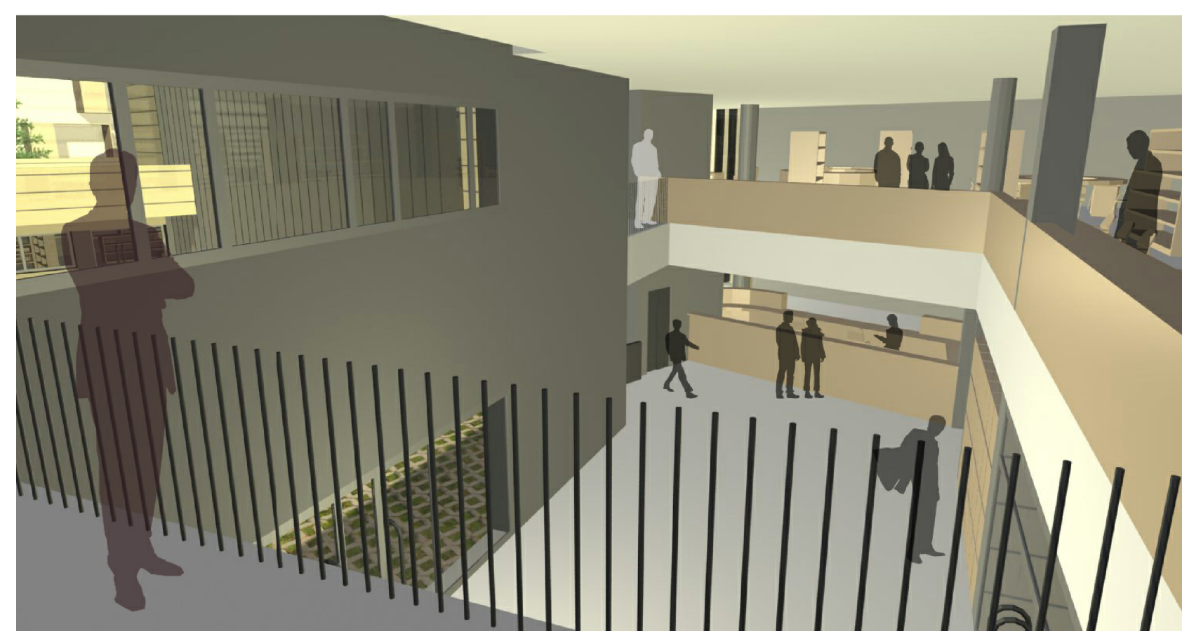
doble alçada vestíbul