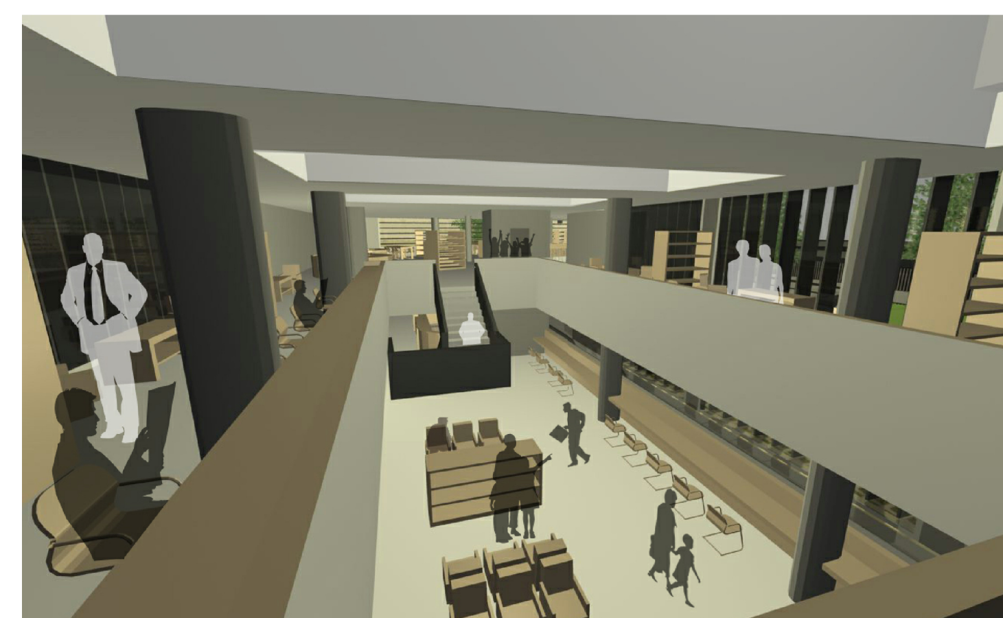
doble alçada biblioteca i llumari