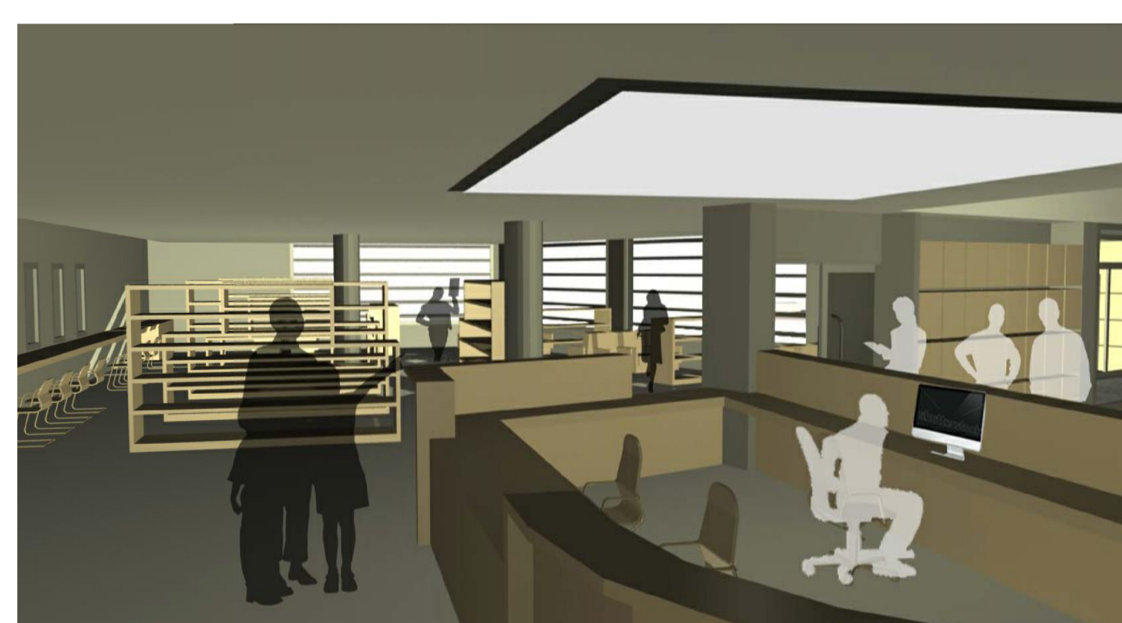
punt informació i servei préstec