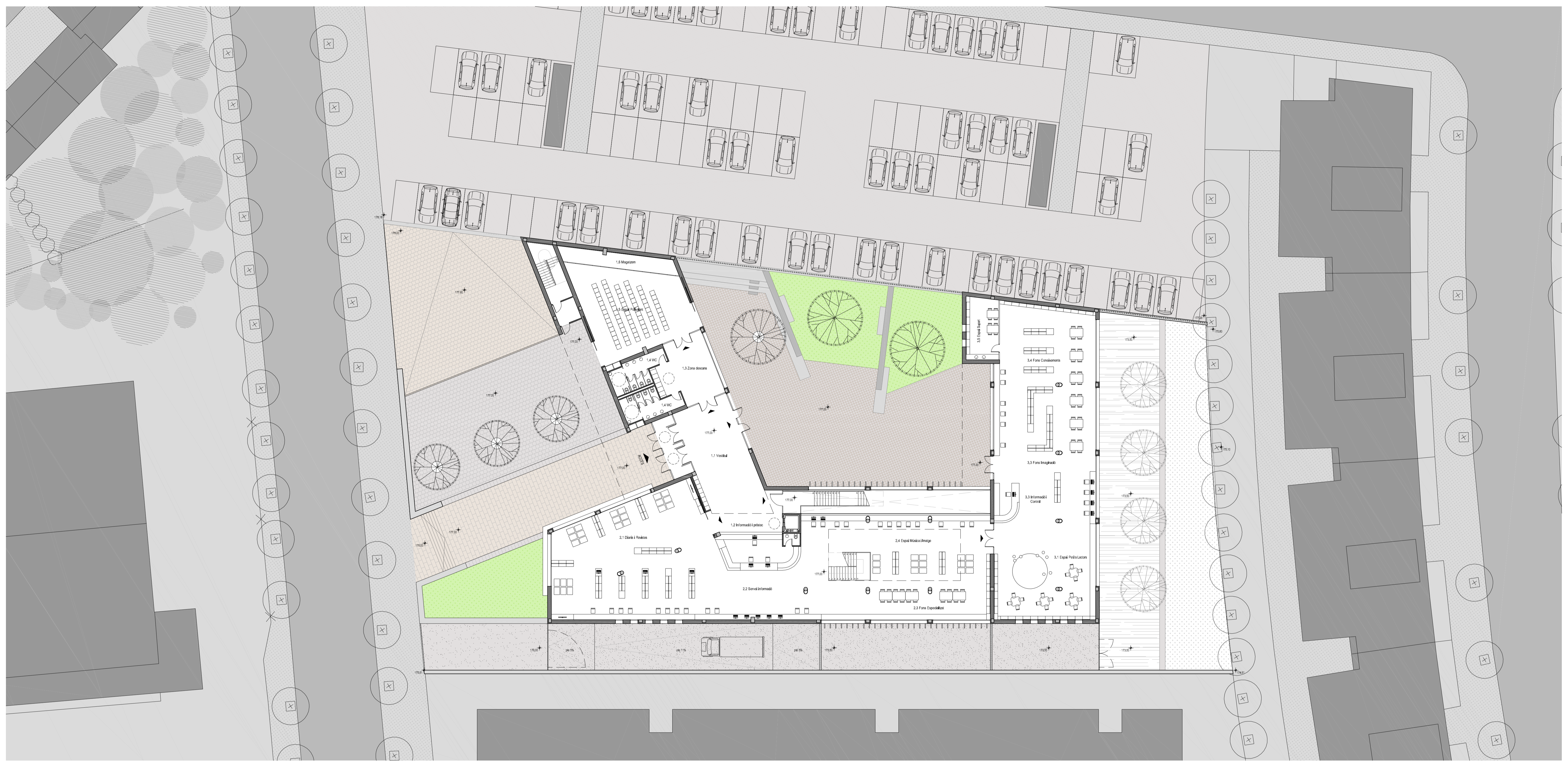
PLANTA BAIXA e: 1/200