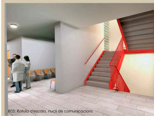
R03: Rotula d'escala, nucli de comunicacions