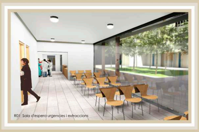
R01: Sala d'espera urgències i extraccions