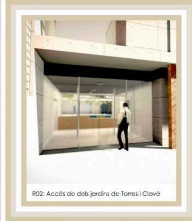
R02: Accés de dels jardins de Torres i Clavé