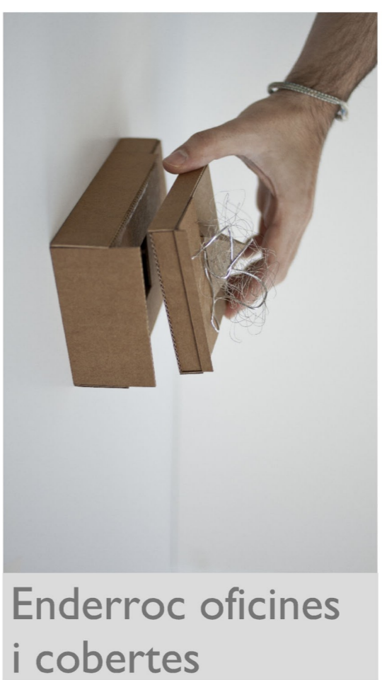
Enderroc oficines i cobertes