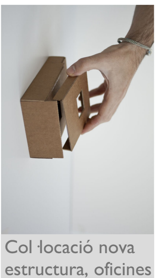
Col·locació nova estructura, oficines