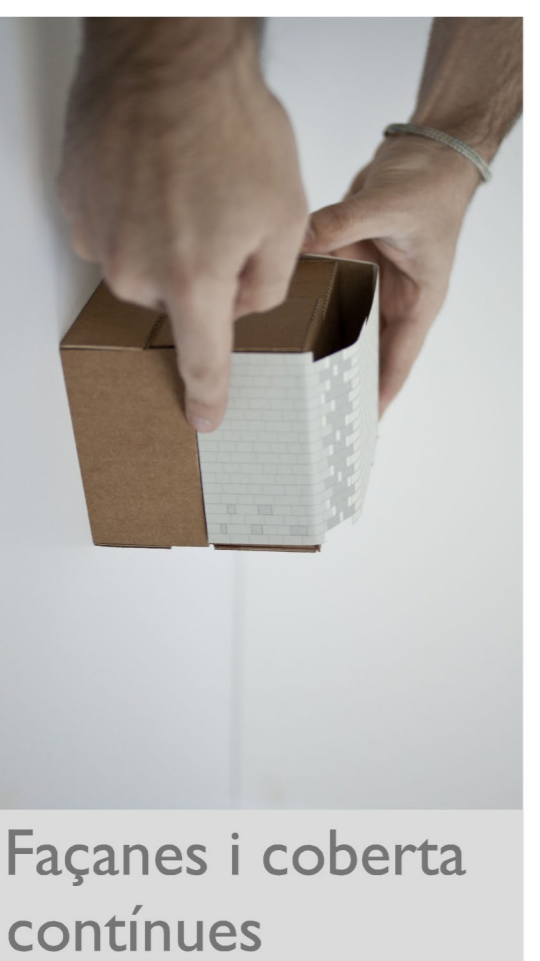
Façanes i coberta contínues