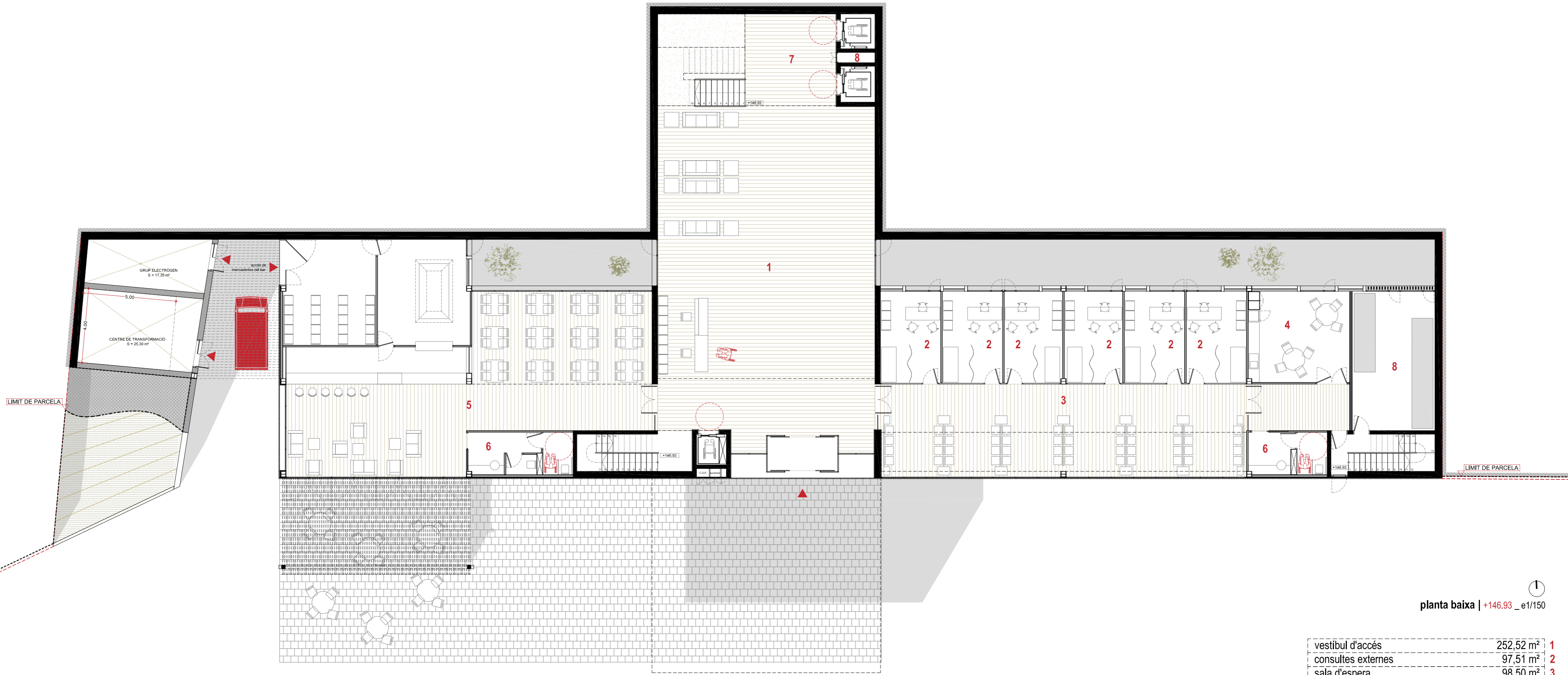
planta baixa | +146.93 _ e1/150