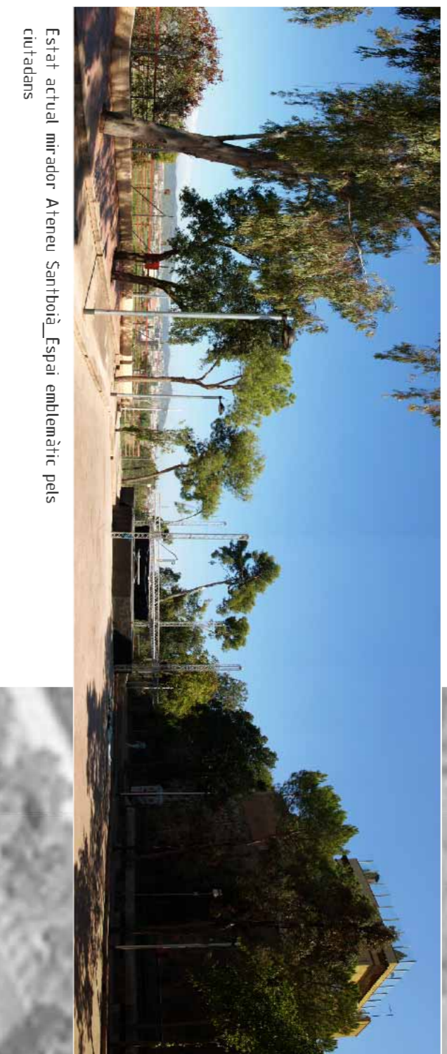
Estat actual mirador Ateuau Santboià_Espai emblemàtic dels ciutadans

1 Estat actual Ateuau Santboià L'Ajuntament va que l'Ateuau Santboià del segle XXI sigui un motor cultural per a la ciutat, què a dinamitzar el nucli històric i recuperar el seu valor simbòlic en la vida local. El passat juny de 2010 es va constituir una comissió d'adreça per debatre i consensuar els criteris per redactar el pla d'òsso del futur Ateuau Santboià, després de que en el mes de maig els terrenys de l'històric equipament van passar a ser de l'Idelitat municipal.