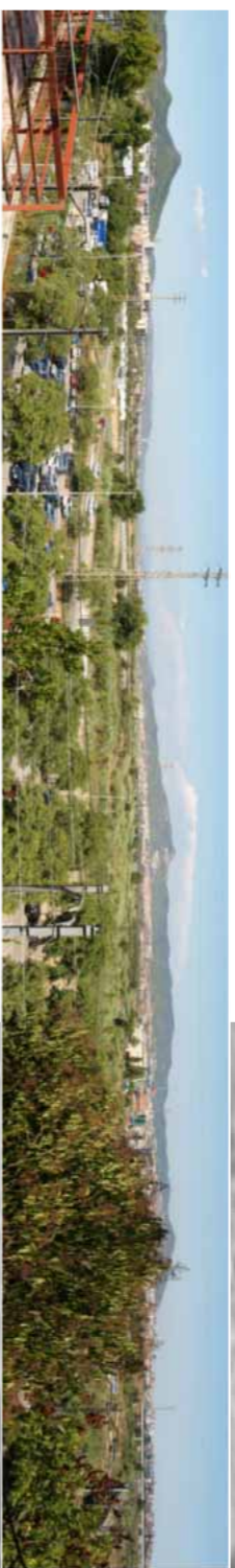
Vistes del mirador cap al parc, organ i el nu Llobregat