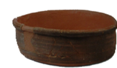
Cassola Segles II - III Ceràmica a torn 7,8 cm x 20 cm