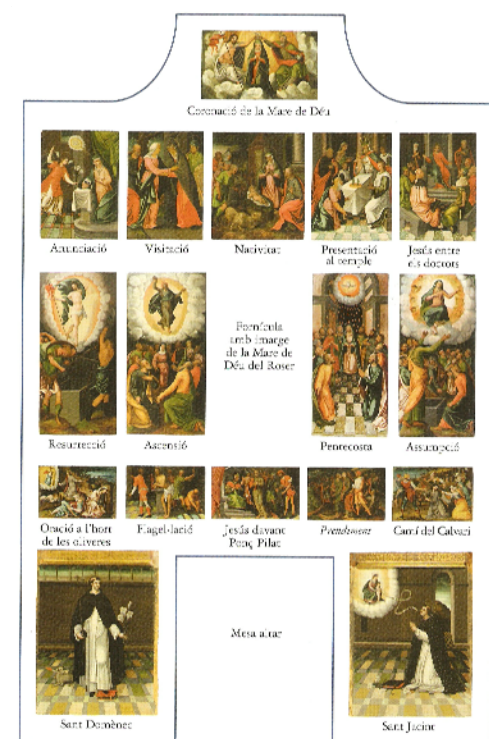
composició del retaul de la Mare de Déu del Roser