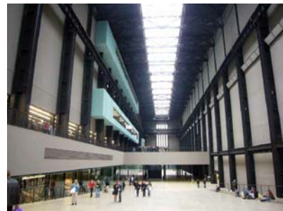
Tate Modern London Arq: Herzog & De Meuron