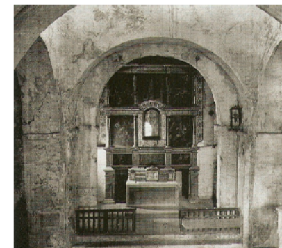
retaul major de Santa Maria (1611 - 1612)