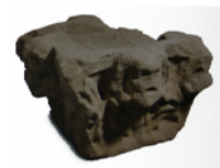
Capitell (s. II). Gres 47 cm x 73 cm x 67 cm