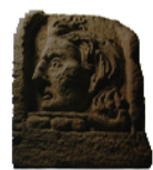
Pedra esculturada S. I Gres de Montjuïc 82,5 x 60 x 45 cm