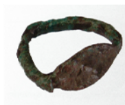
Anell 100 aC - 50 aC Bronze 2,2 cm x 2,4 cm