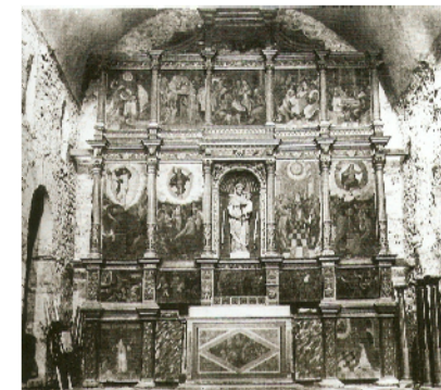
retaul de la Mare de Déu del Roser