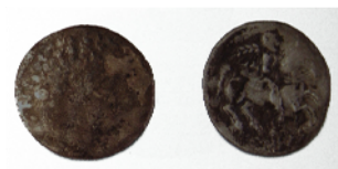
Moneda 200 aC - 150 aC Bronze i plata 20 mm Ø