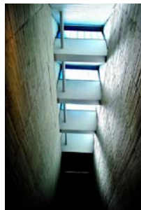
Museu Provincial de Zamora Arq: Mansilla - Tuñón

Per evitar agressions (per exemple, vidres per a pintures emmarcades).