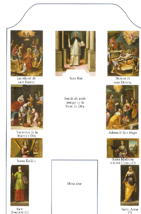
composició del retaul major de Santa Maria