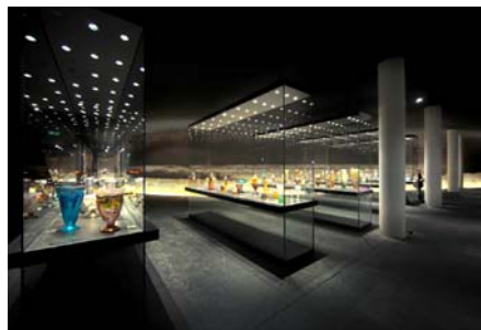
Museu Bejles Arts de Nancy Arq: Beaudouin - Husson