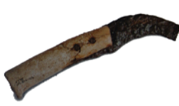
Ganivet Carní ultra Ferro i os 143 x 23 x 20 cm