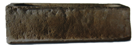
Caixa de sarcòfag Mitjan s. IV Marbre 64,5 cm x 221,5 cm x 58 cm