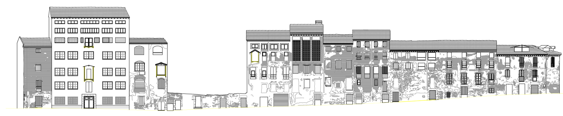
Alzado norte. Estado actual E 1:500