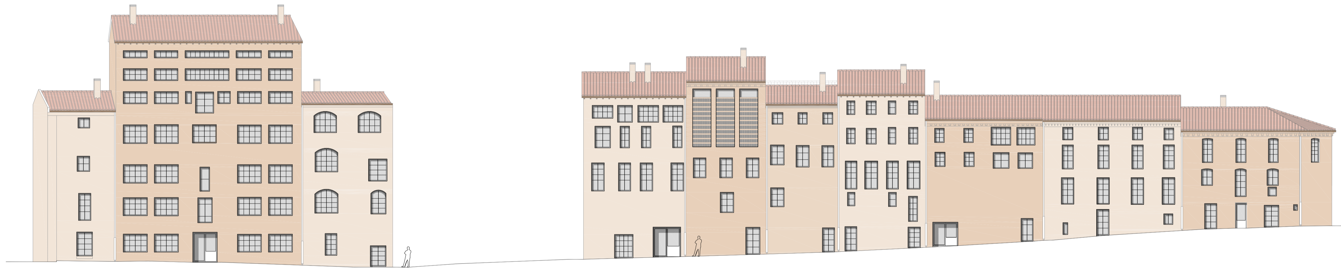
Alzado norte. Propuesta E 1:200