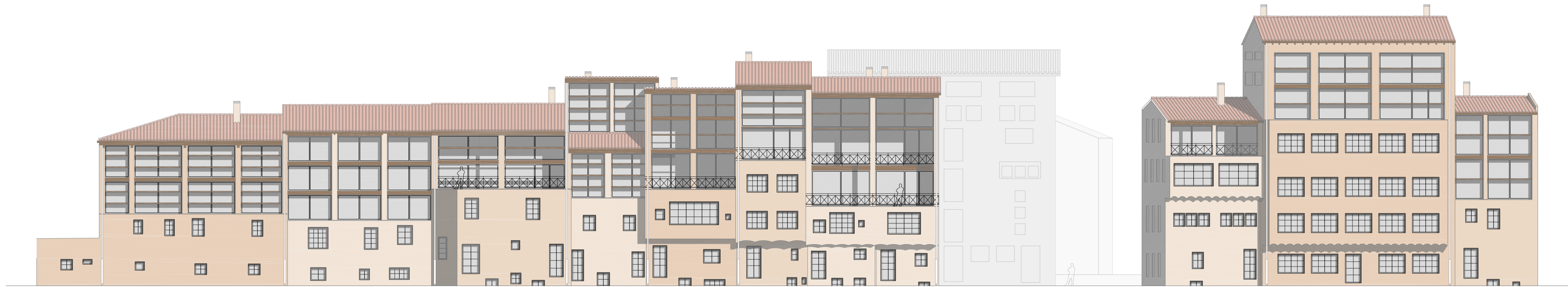
Alzado sur. Propuesta E 1:200