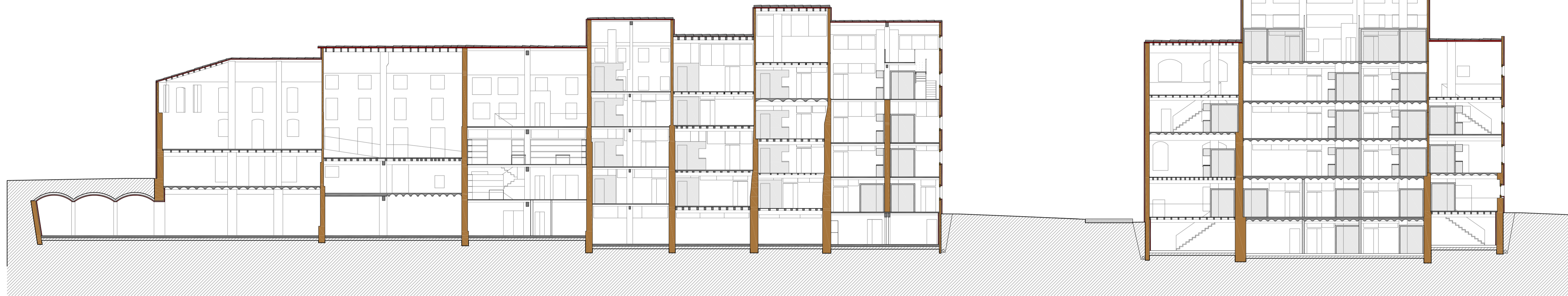
Sección longitudinal A. Propuesta E 1:200