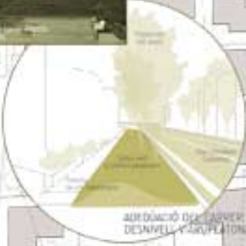
ABORDACIÓ DEL CARRETER: DESNIVELL I GRUPLATONS