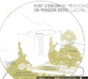
PUNT D'ENCONTRE MERIDIONAL: UN MIRADOR ENTRE LAGUNA I MAR