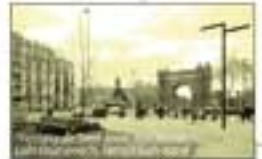
UNA GRADUACIÓ CAP A LA LAGUNA: CANVI DE TOPOLOGIA CARRETER-PARCS