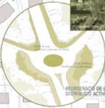
REORGANIZACIÓ DE LA ROTONDA: DISTRIBUCIÓ ACTIVITATS/REPOS