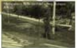
UNA PENSA LONGITUDINAL: DISPOSITIUS DE RELACIÓ I RELEVÀNCIA DE LES ACTIVITATS INSULARS