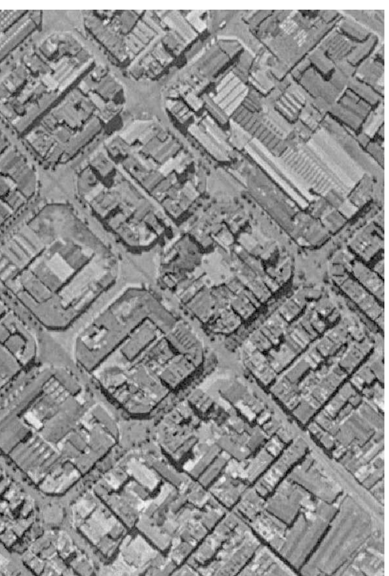
DE 1890 A 1896: DESINDUSTRIALITZACIÓ

LES PRINCIPALS ACTIVITATS PRODUCTIVES VAN SER EL HAN DE TÈXIL, LA MANIPULACIÓ D'ALUMINIS I VINS, LA METAL·LÚRGIA I LA CONSTRUCCIÓ, sense oblidar l'exportació agrícola a que sempre va coexistir amb l'ús INDUSTRIAL.