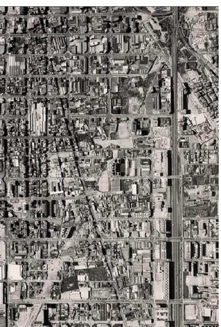
DE 1986 A 1996: RENOVACIÓ PROGRESSIVA

A MÉSQUA QUE LES INDÚSTRIES VAN ANAR MARXANT DEL DISTRICTE DE SANT MARTÍ, ELS SEUS BARRES ES VAN ANAR DESQUANTANT, LES FÀBRILS VAN SER DESOCCUPADES I ABANDONADES A LA DERELICCIÓ, I ELS ESPAYS BUNTS VAN ANAR SENT OCCUPATS PER ACTIVITATS VINCULADES AL TRANSPORT, FET QUE CONTRIBUÍ DESMÉS AMB L'ÚS DETERMINADAMENT D'ADQUIRIR ESPAI URBÀ.