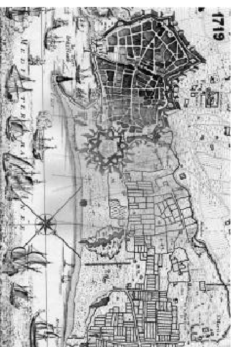
OHIBERS DE 1700 A 1880

SANT MARTÍ DE PROVENIÈNCIA FOU UN MUNICIPI INDEPENDENT DE BARCELONA FINS A 1897, QUAN FOU ANNEXIONAT AL TERME MUNICIPAL BARCELONÀ, JUNTAMENT AMB SANTS, GRÀCIA, LES CORTS, SANT GERMI I SANT ANTONI, QUE TAMBÉ VAN PERDRE LA SEVA AUTONOMIA JURISDICCIONAL.