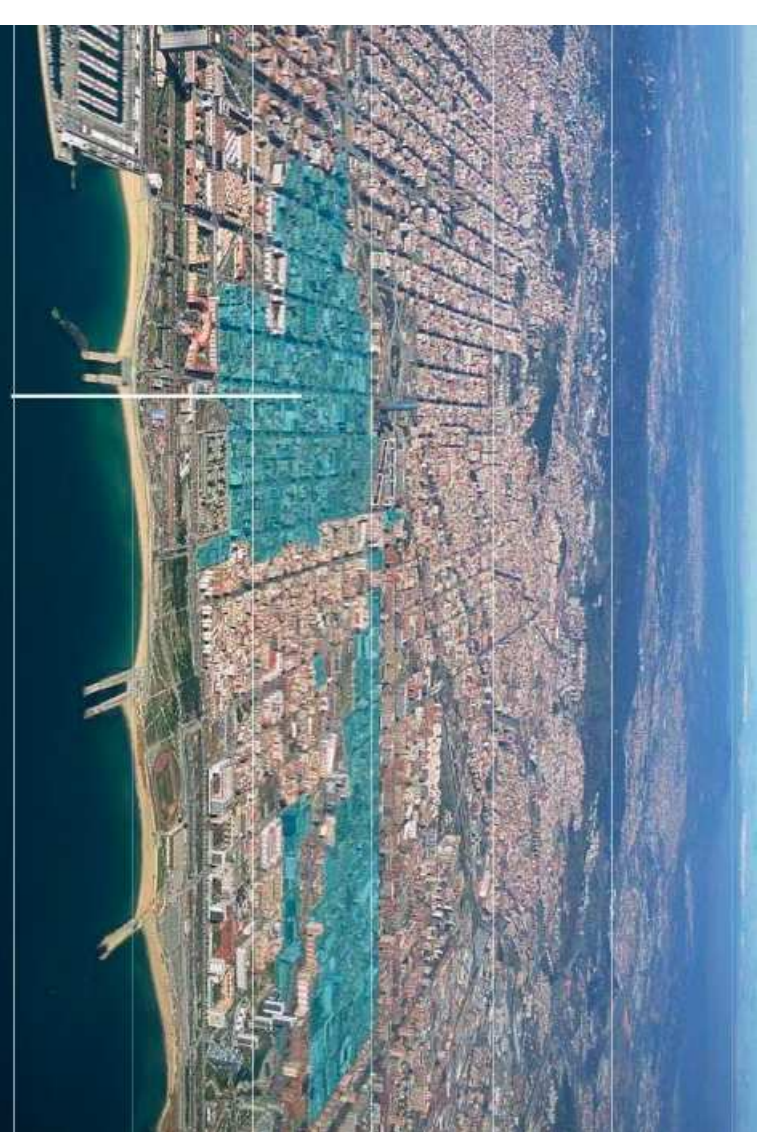
A PARTIR DEL 2000: PROCTE 22@

EL PROCTE REINTERPRETA LA FUNCIÓ D'ELS ANTS TERMS INDUSTRIALS DEL POBLENOU I CREA UN NOU MODEL, DESPÀ URBÀ, QUE S'INSTRUEIX L'ANITIDOR QUALIFICACIÓ URBANÍSTICA, QUE ESTABLA UN ÚS EXCLUSIVAMENT INDUSTRIAL, EN ADQUIRIR AREES DEL CENTRE DE LA CIUTAT, PER LA NOVA CIUTAT 22@, S'ADMET LA CONECTACIÓ DE TOTES LES ACTIVITATS PRODUCTIVES, NO MOCLES NI CONTAMINANTS I NORMALITZA LA PRESENCIA D'ELS HABITADES QUE DES DE 1963 ESTAVEN AFECTATS, AFANORREX LA SEVA REHABILITACIÓ.