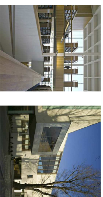
Biblioteca de Turku, Finlandia, JKKM