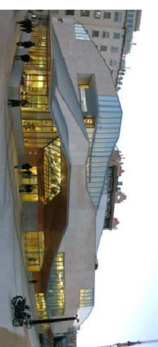
Biblioteques noves de Sabadell