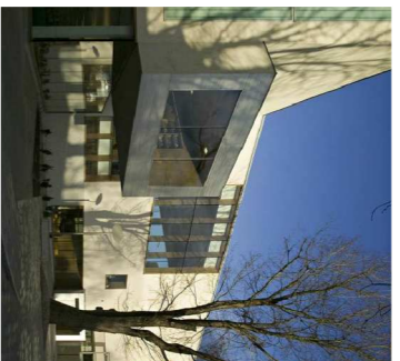
Biblioteca de Pirkkala, Finlandia