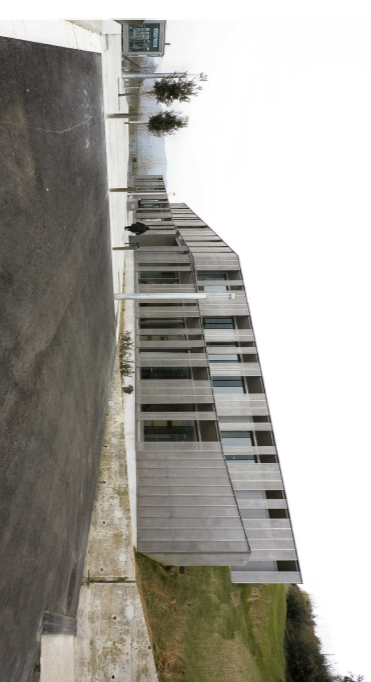
Biblioteca Esteve Paluzies, Barberà del Vallès, UTE