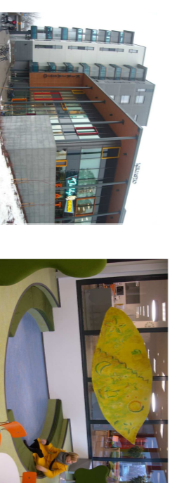
Biblioteca "Metsä" en Tampere, Finlandia – Reina Pietilä & Raii Pietilä