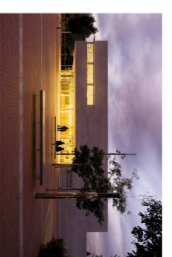
Biblioteca de Lesseps, BCN, Josep Linàs