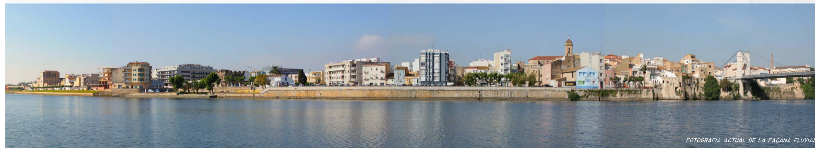
FOTOGRAFIA ACTUAL DE LA FAÇANA FLUVIAL