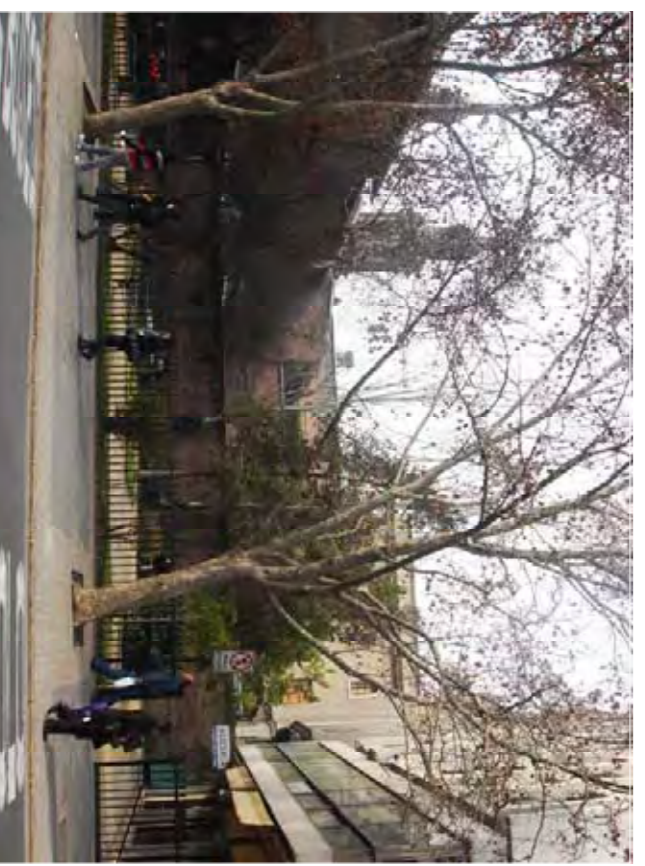
Parc del C/ Bandera.