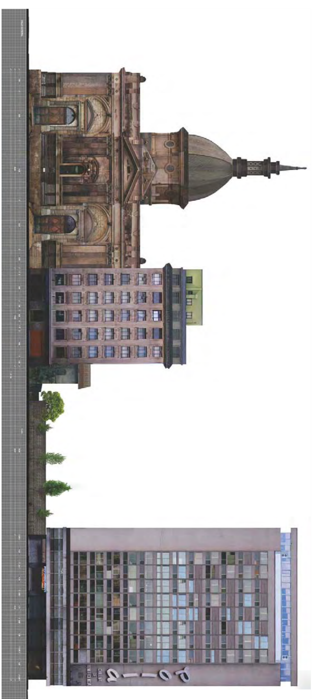
Façana Oest Carrer Bandera