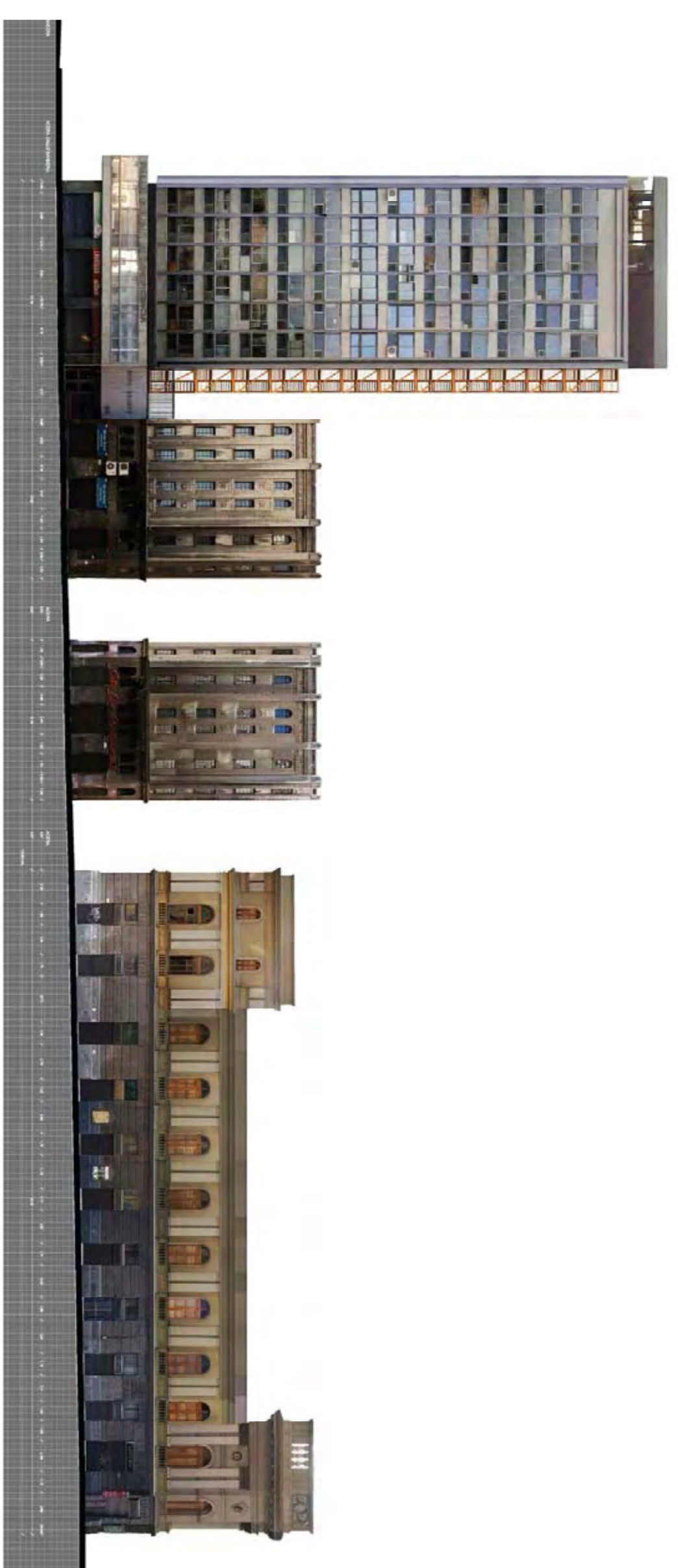
Façana Sud Carrer Compania