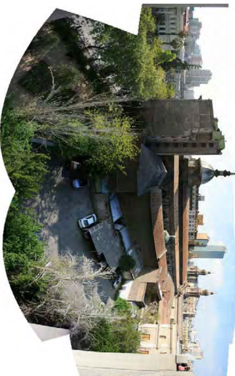
Visita de restaurant darrere Hotel City i el parc.