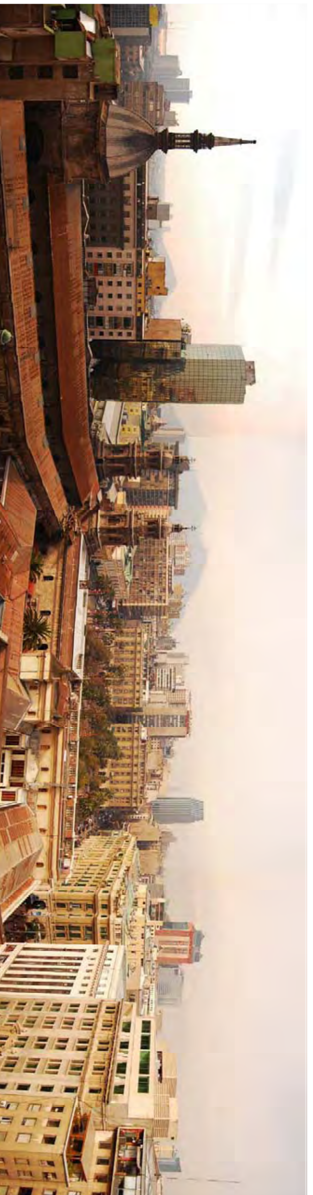
Visita des de l'edifici de La Paia cap a la catedral i la Plaza de Armas.