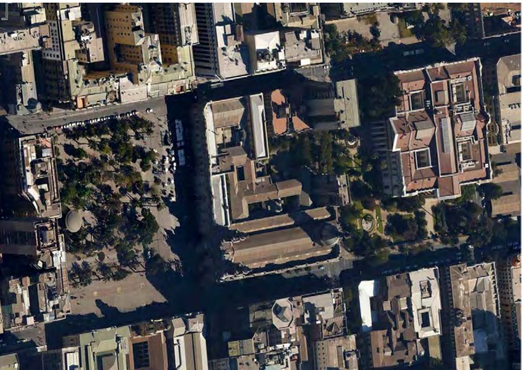
Visita des de Est. de la Plaza de Armas, la mansana on s'ubica el projecte i el Congrés.

Tot està batallat i amb portes per tancar-ho al públic. En aquesta menxa també hi tenim la calçada de Santiago amb els seus arbres i la façana i entrada principals estan a la Plaza de Armas. Són per veure una entrada entre ella i el palau que el porta a l'interior a través de alguns dels seus passadís connectats amb el parc a l'interior de la ciutat i el carrer. El projecte de recuperació del Hotel City ocuparà la parcel·la dequest i intervingrà també en el parc i el passadís privat.