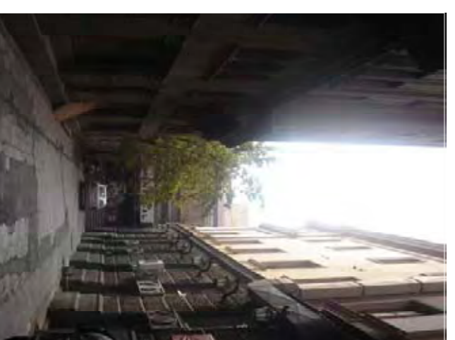
Carrer privat entre Hotel i el Palau.