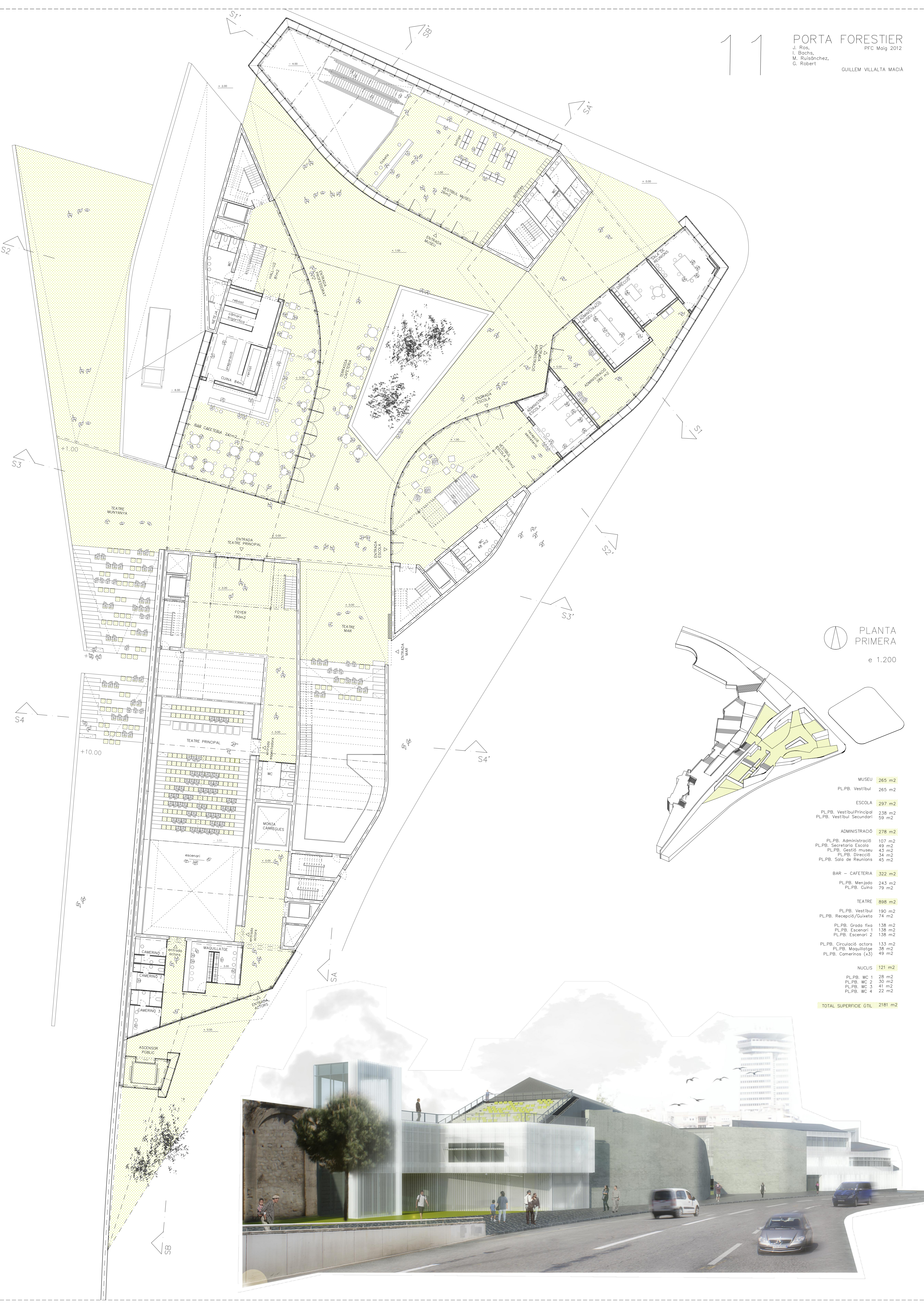
PLANTA PRIMERA e 1.200