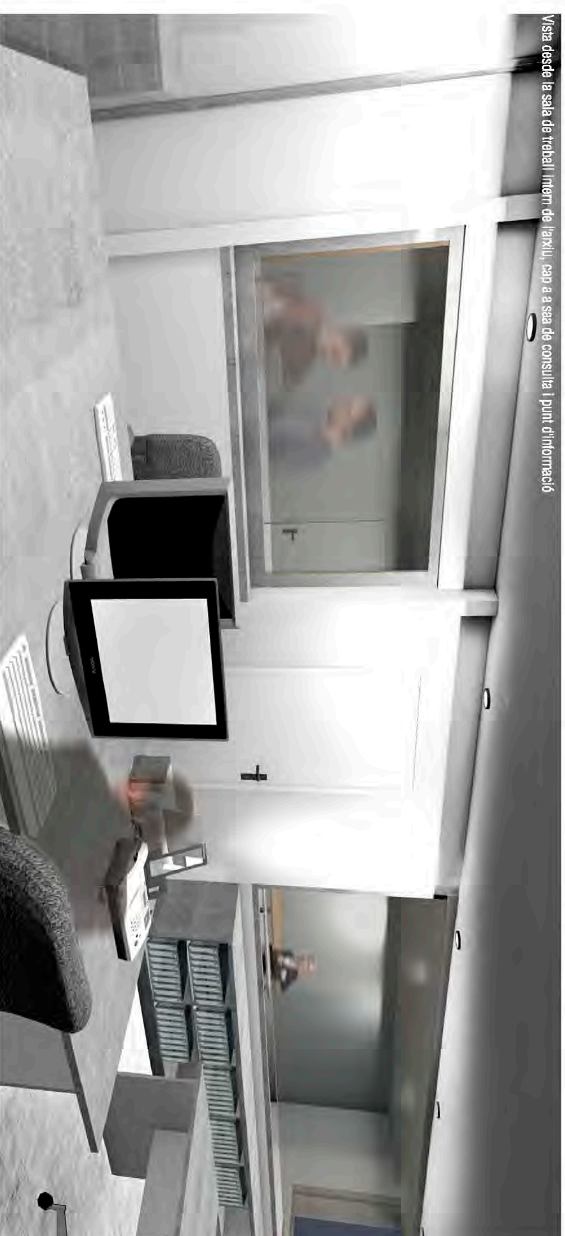
Vista desde la sala de consulta de l'arxiu

Vista desde la sala de treball intern de l'arxiu, cap a sala de consulta i punt d'informació