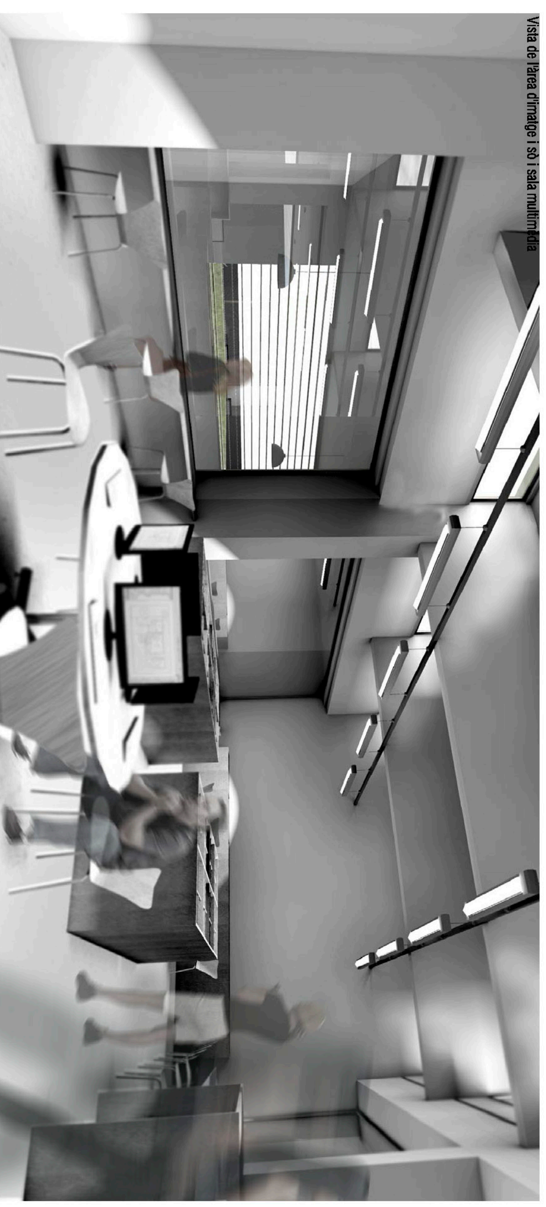
Vista de l'area d'informació i sala multimèdia