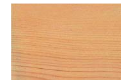
CEDRE VERMELL THUJA plicata