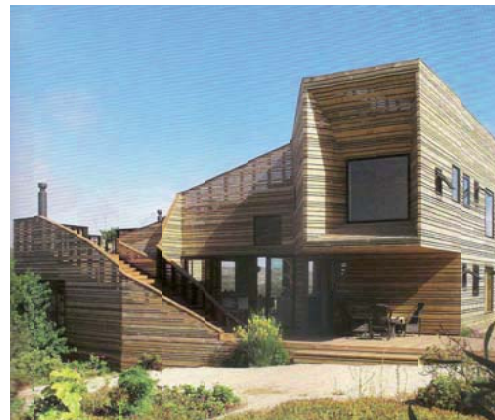
METAMORPHOSIS HOUSE A CASABLANCA (CHILE)