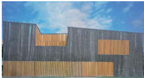
HABITATGE UNIFAMILIAR A GORRAIZ

Degut a l'orientació Est - Oest principal en les obertures de l'edifici, les lames tenen un sentit vertical per tal d'optimitzar la seva protecció solar.