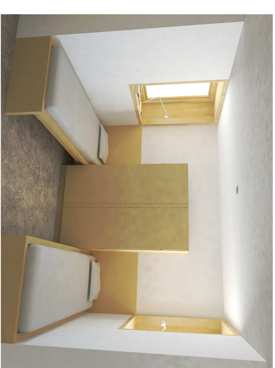
SECCIÓ B E:1/50