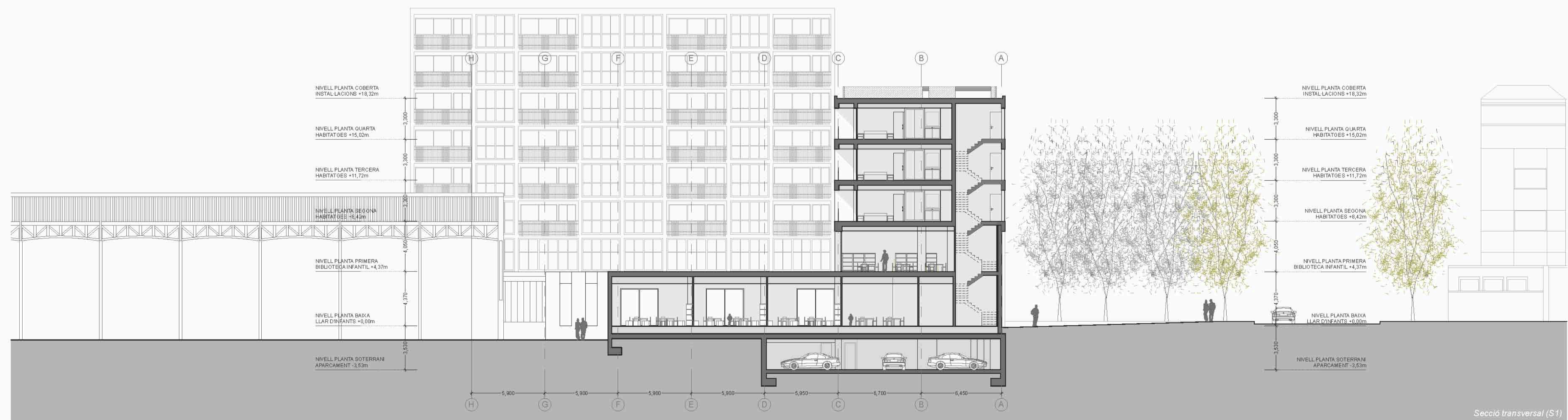
Secció transversal (S1)