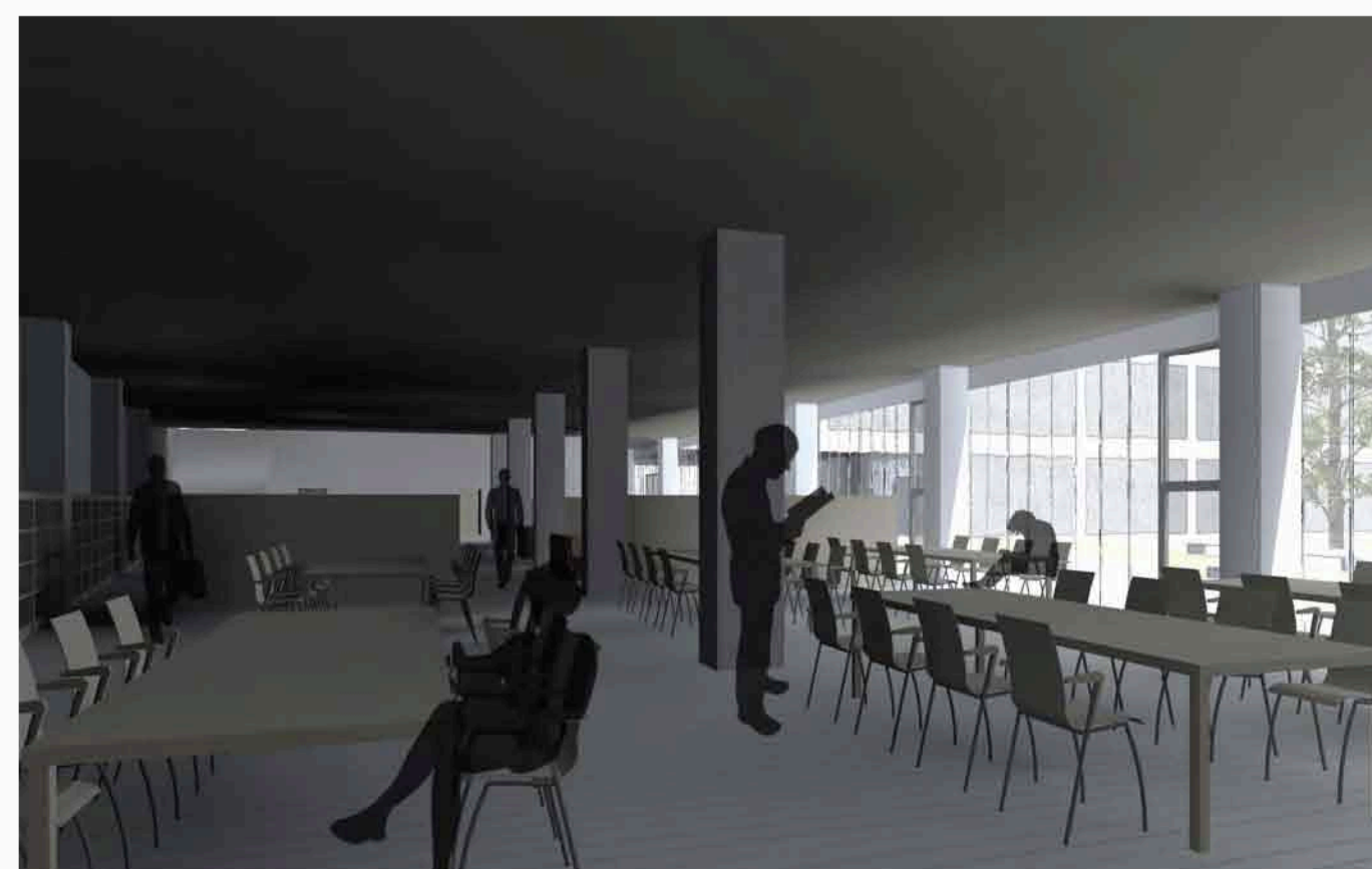
Imatge 12. Perspectiva interior de la biblioteca (planta baixa)