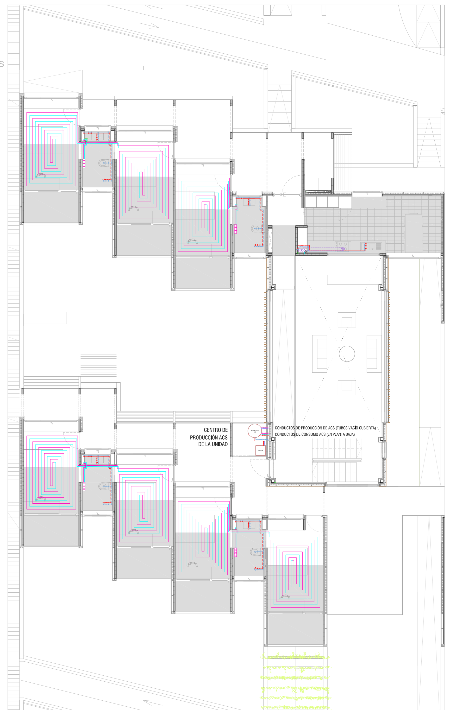
ELECTRICIDAD PLANTA PRIMERA