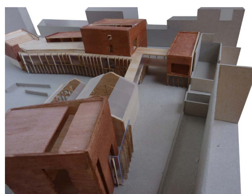
2. Vista cap al sud del nou pas obert