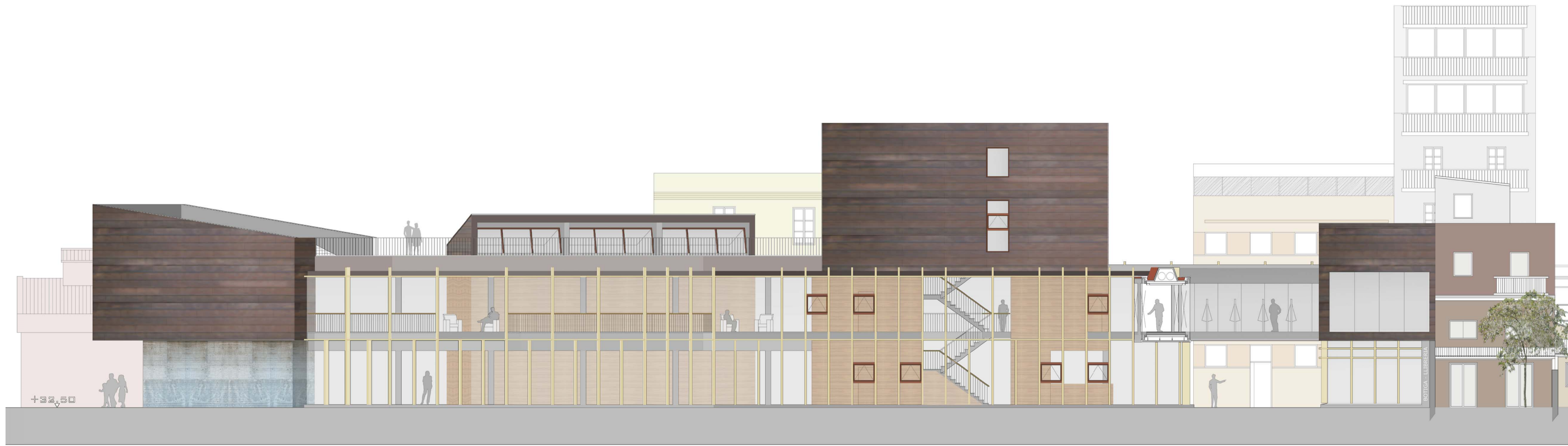
alçat 3, e.1/100