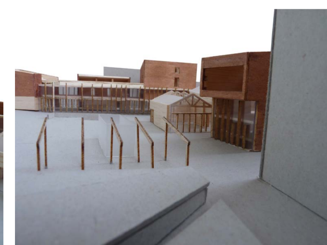
4. Vista de la façana nord del conjunt des del parc