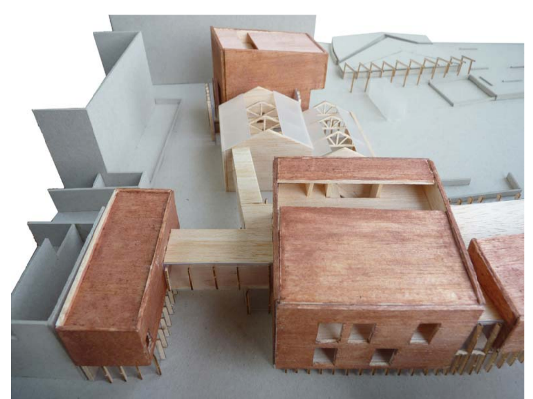
1. Vista cap al nord del nou pas obert