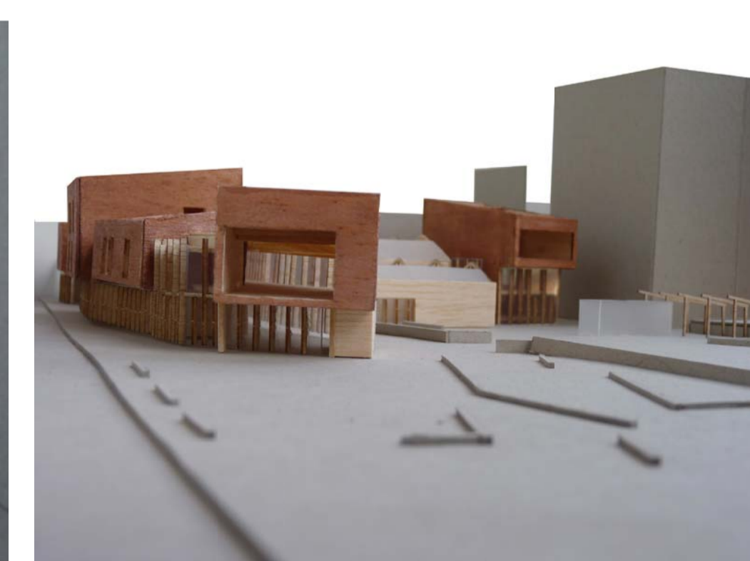
5. Vista de la façana est des de la cruïlla C/Joan Güell-C/Rosés