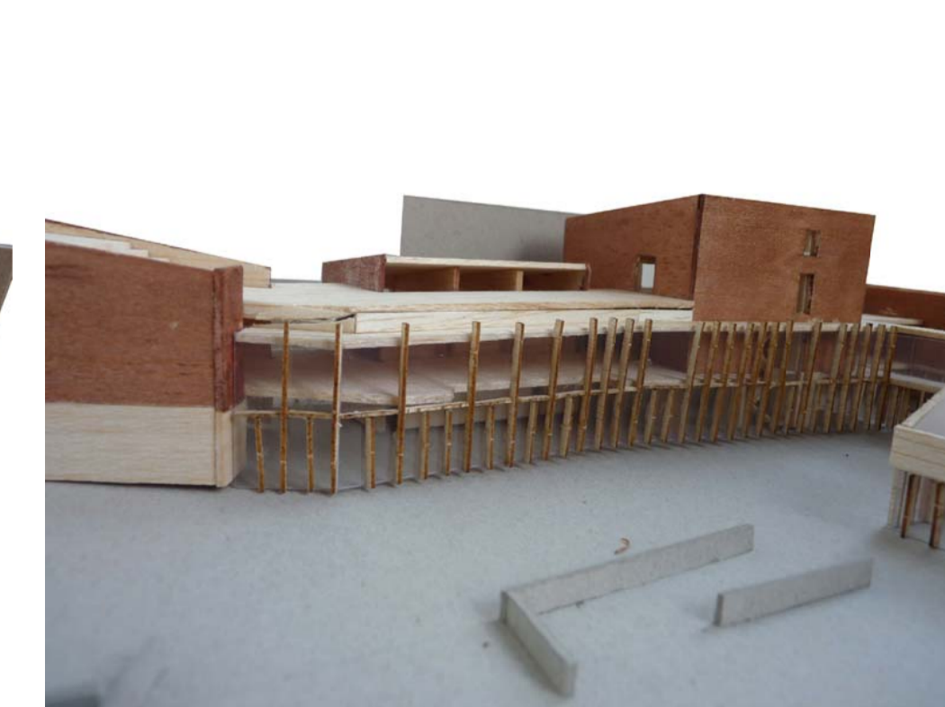
3. Vista de la façana nord, que s'obre a la plaça