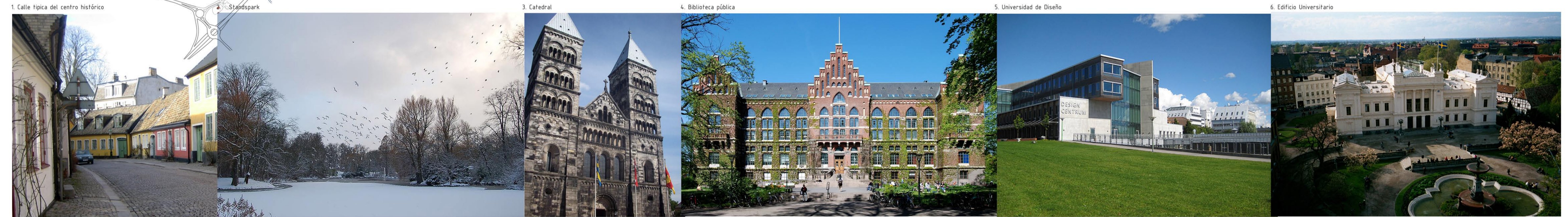
1. Calle típica del centro histórico