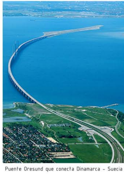
Puente Oresund que conecta Dinamarca - Suecia

Otro dato a destacar de esta ciudad es que es e Centro Tecnológico del Neutrón de la Unión Europea y candidata a la Capital Europea de la Cultura para el 2014.