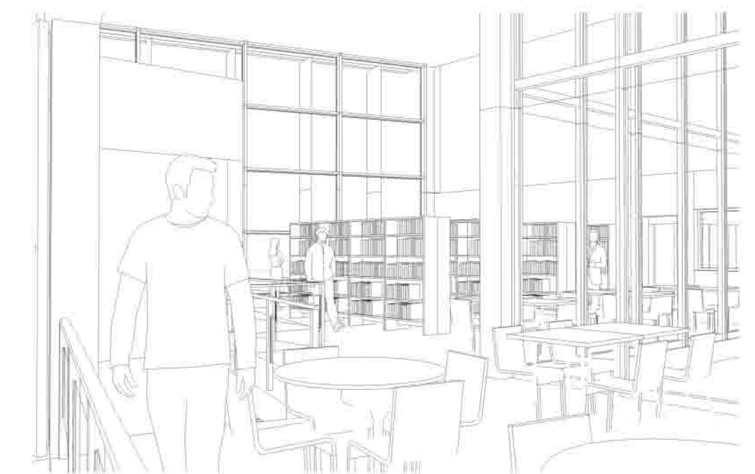
Vista acceso de planta hacia sala general