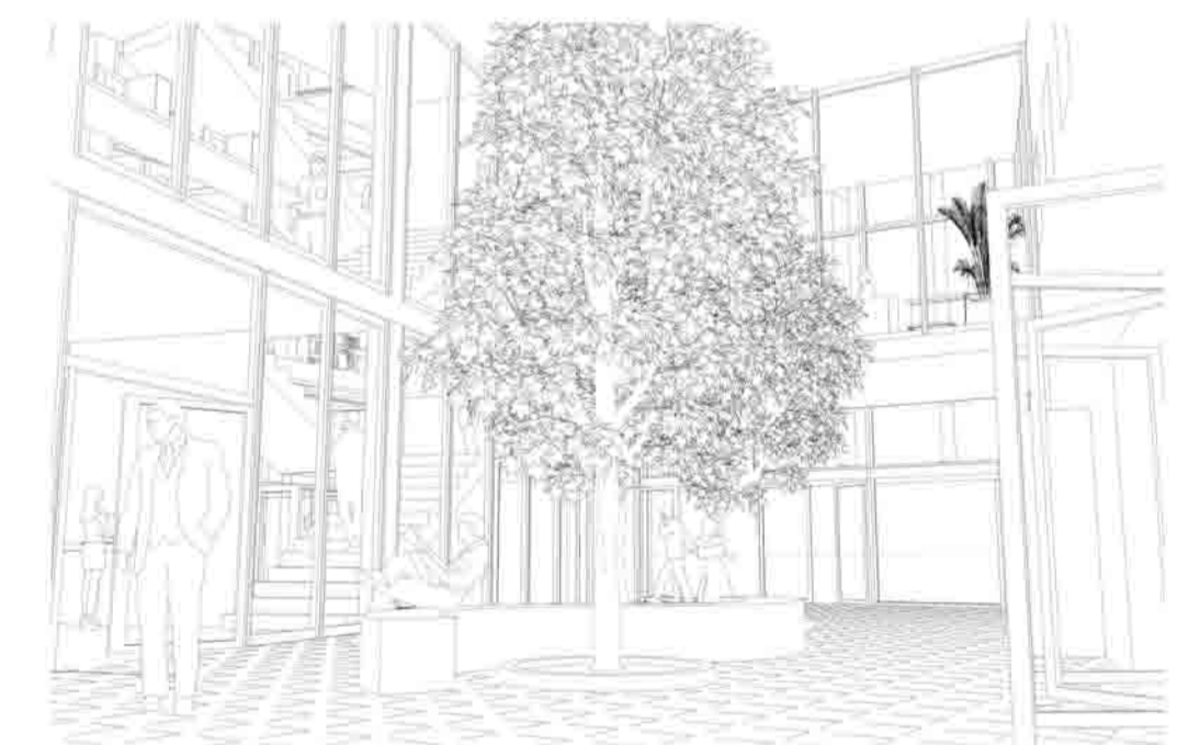
Vista vestibulo de entrada.