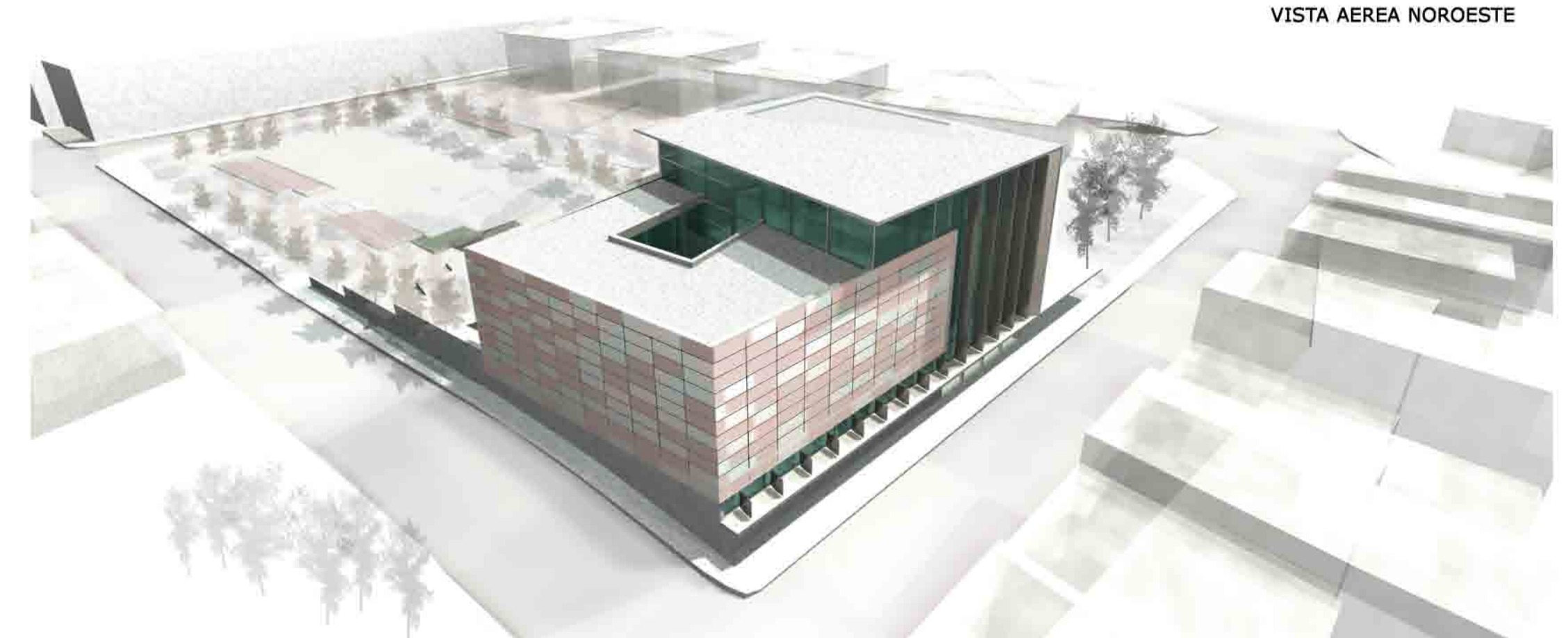
VISTA AEREA NOROESTE