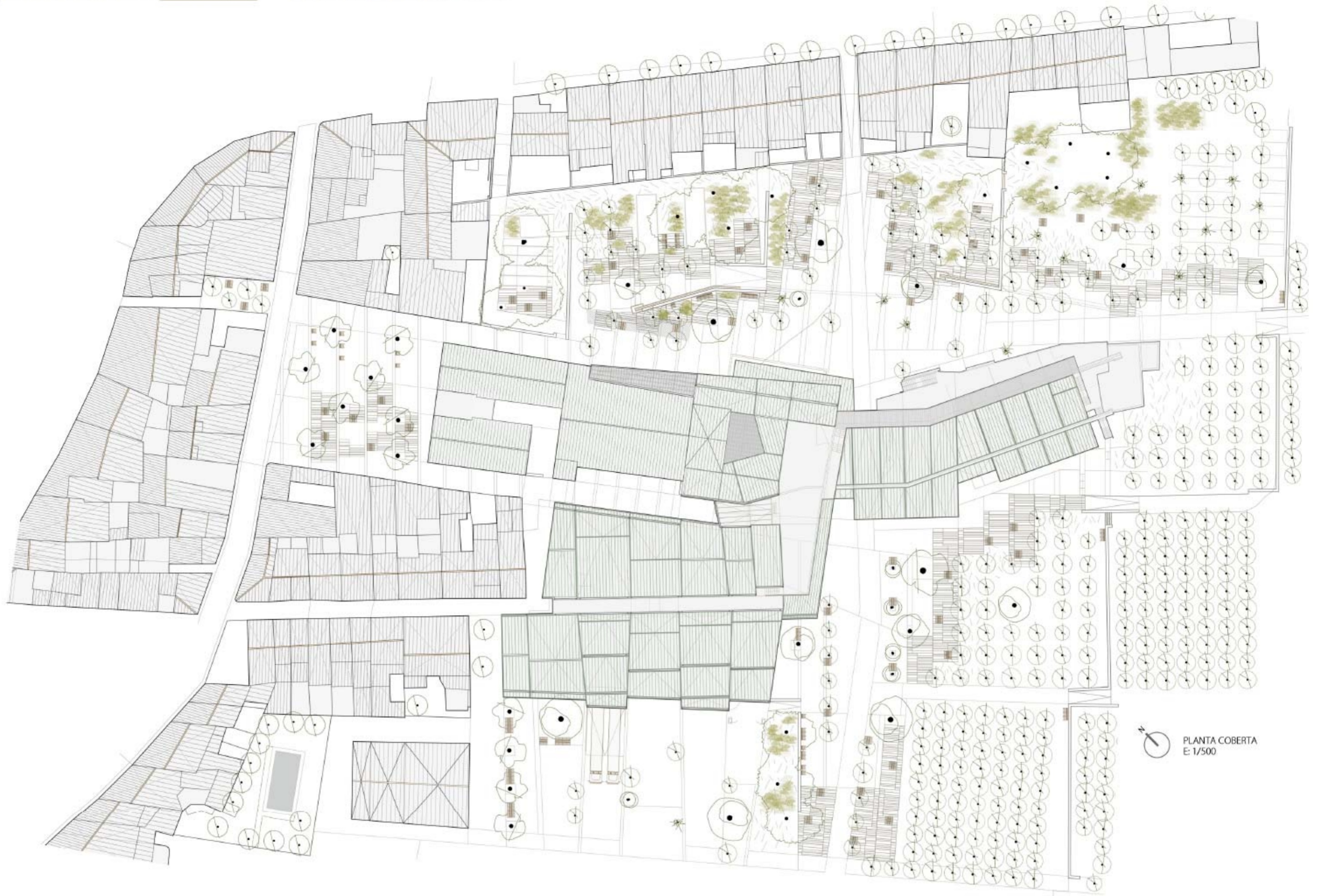
PLANTA COBERTA E: 1/500