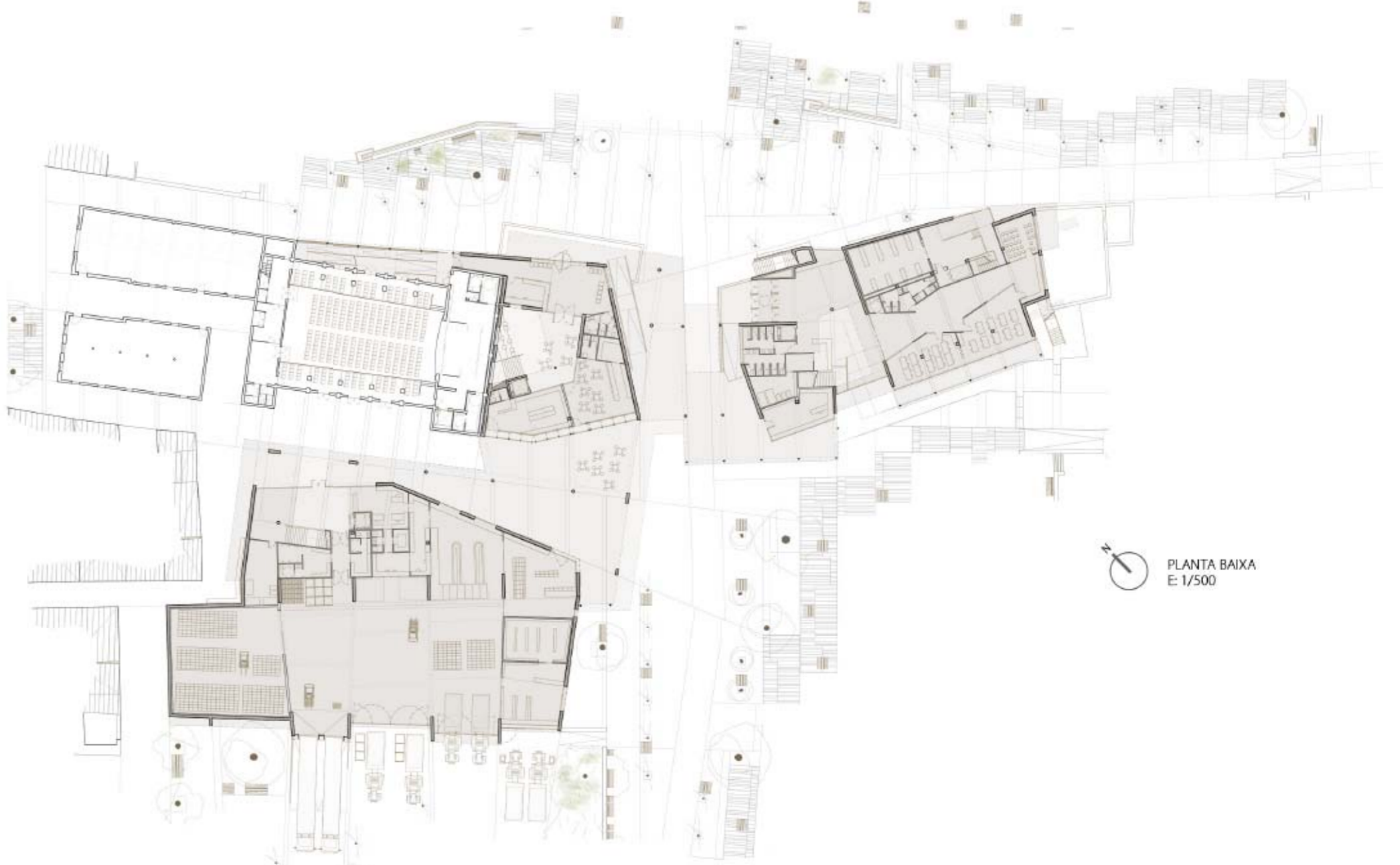
PLANTA BAIXA E: 1/500