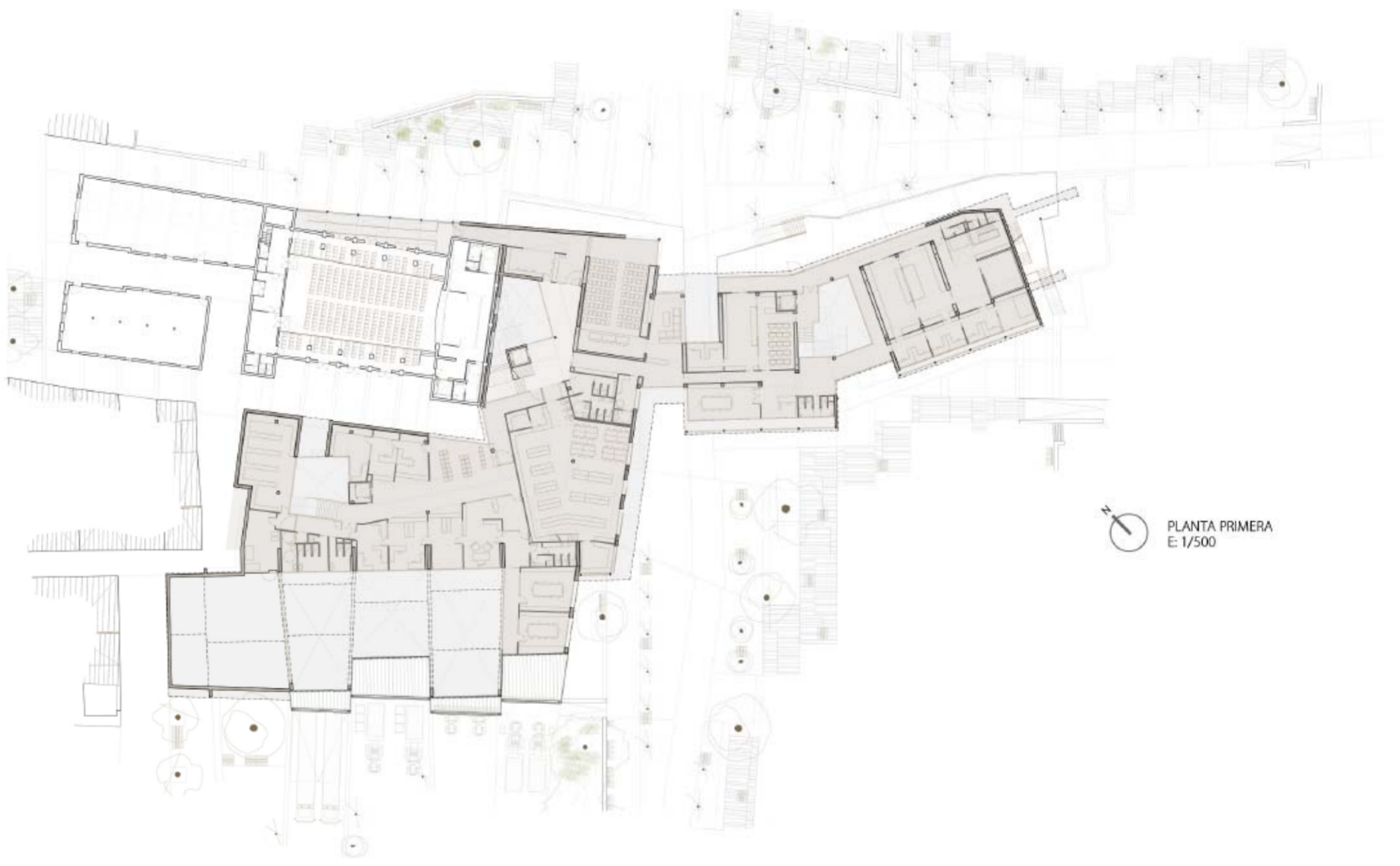
PLANTA PRIMERA E: 1/500