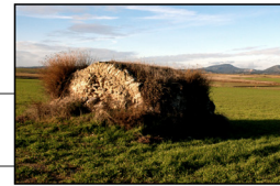
L'arquitectura de les voltes Total la part dels "Plans" on es cultiva bàsicament cereal, hi trobem els aixoplucs tradicionals, que utilitzaven antigament els ramaders per protegir-se de la pluja i dormir. A més trobem corralles, com el "Corral de Verche", on es tancava el bestiar.