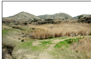
Els pous i manantials Les aigües subterànies que emergeixen a la superfície, es situen dintre de la formació de les gesses bàsicament, malgrat podem trobar en tot el territori aigües freàtiques.