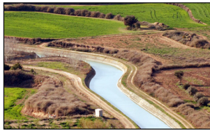
Situació del Canal respecte la geografia La geografia de "La Gessa" fa de límit, un límit que es reseguit pel Canal d'Aragó i Catalunya, per tal d'abarcabar al màxim possible els cultius de regadiu.