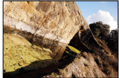
Els Aljubs Els àrabs van saber aprofitar la geografia del lloc, en concret la formació Peraltilla per situar els aljubs, aquests dipòsits d'aigua esculpits en la roca.