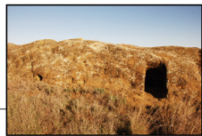
Els Castellassos Els àrabs van saber aprofitar la geografia del lloc, en concret la formació Peraltilla per situar els aljubs, aquests dipòsits d'aigua esculpits en la roca.