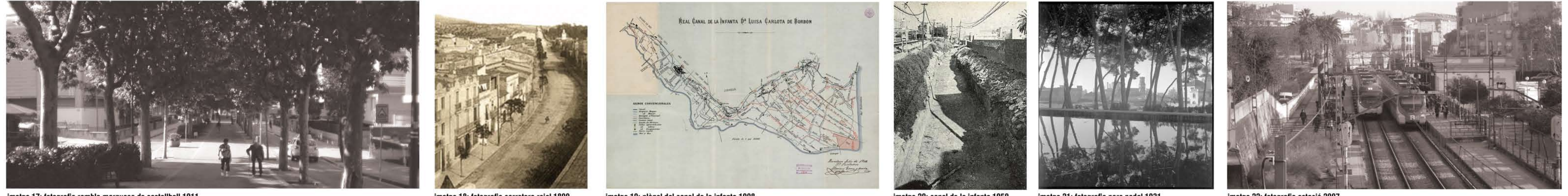
imatge 17: fotografia rambla marquesa de castellbell 1911 imatge 18: fotografia carretera real 1899 imatge 19: plànol del canal de la infanta 1908 imatge 20: canal de la infanta 1950 imatge 21: fotografia parc nadal 1931 imatge 22: fotografia estació 2007