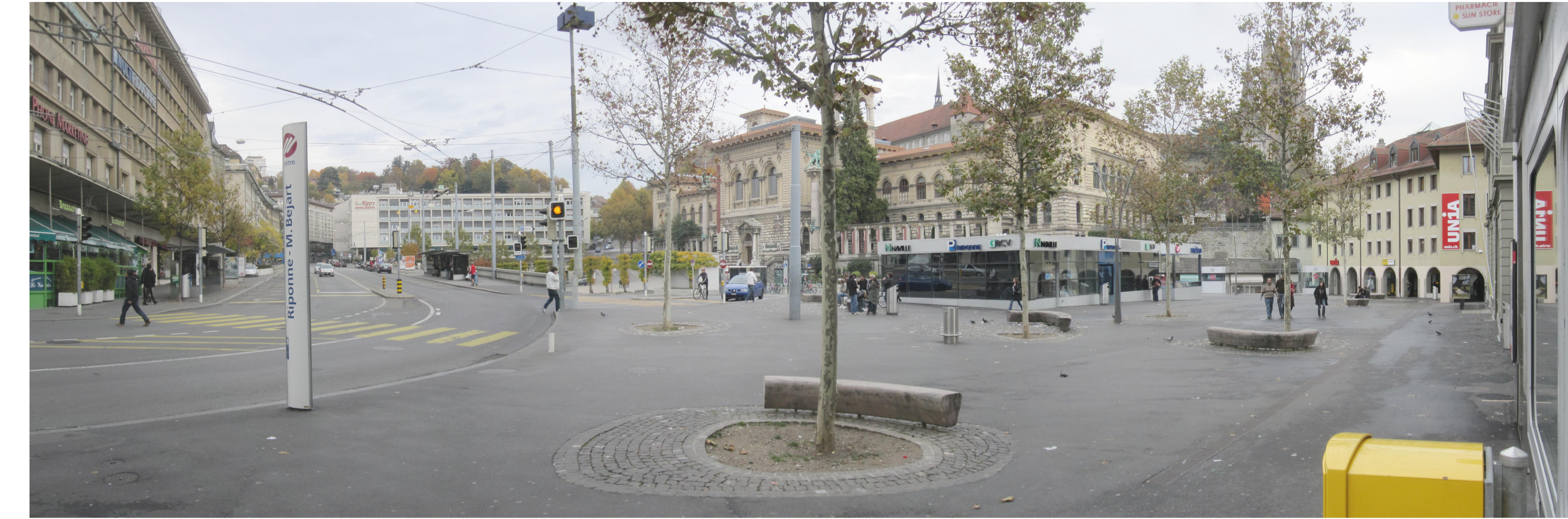
vista des de l'encreuament de rue nouve amb larue du tunnel estat actual