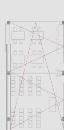
Sala de suport i de formació