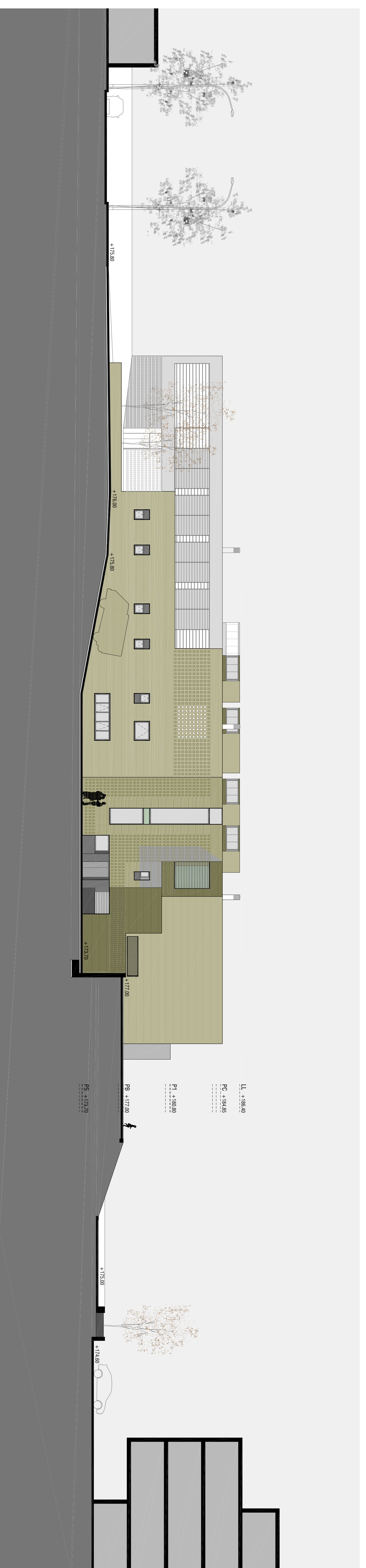
SECCIO 5-5. FAÇANA OEST