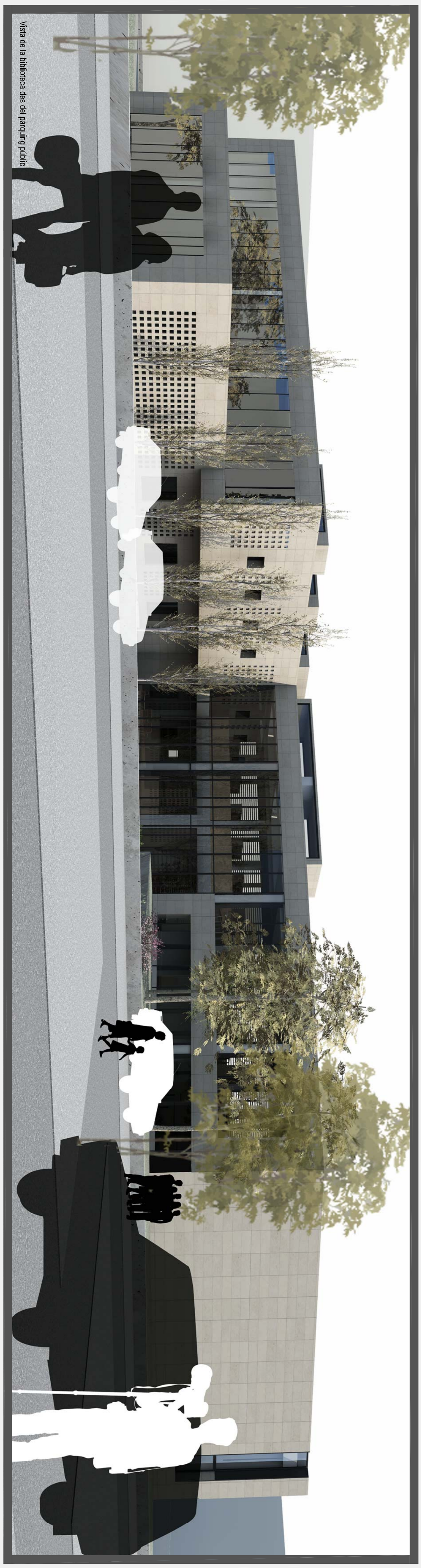
Vista de la biblioteca des del parcuing públic