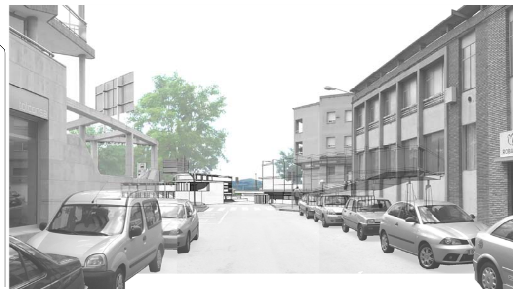
V3. PRESERVACIÓ VISUALS DE RELACIÓ CIUTAT-ENTORN

Preservació de la relació ciutat-entorn: L'edificació es situa de manera que la relació visual que estableix la població amb el massís del garraf es preserva garantint així l'escala de la població respecte el territori.