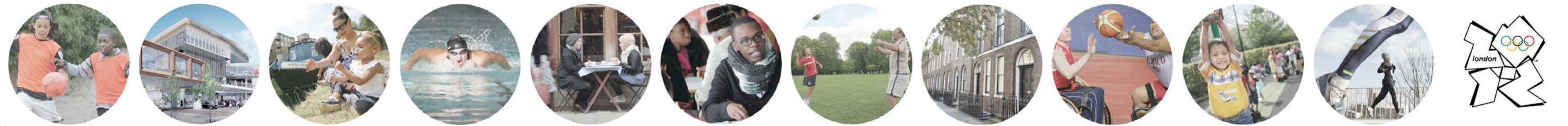
Stratford, passat, present i futur, carta de presentació del Londres Olímpic, 2012