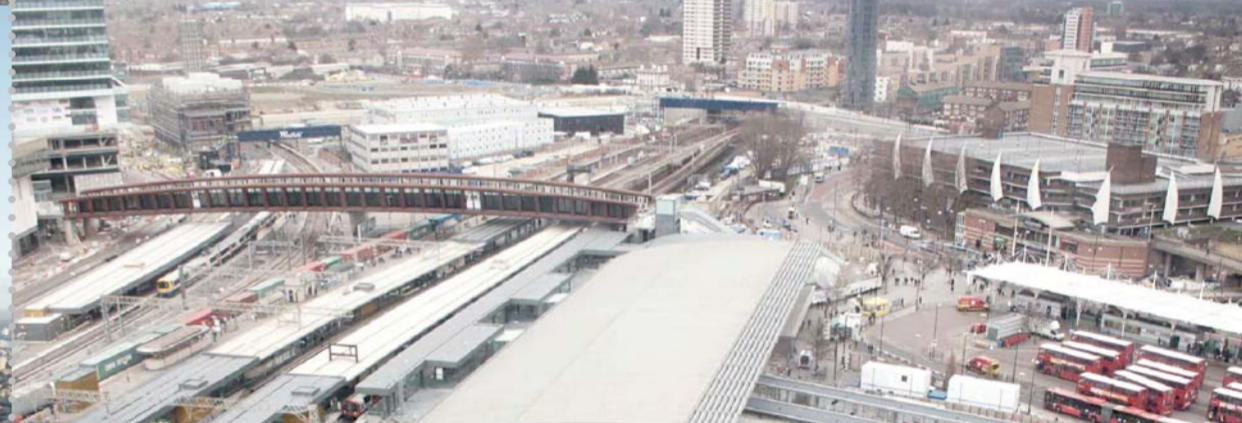
Solar proper per al nou Plaça de 220.000 m² de la línia