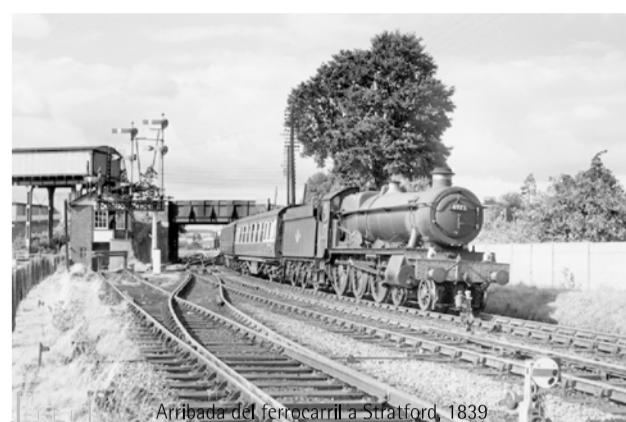
Arribada de la primera línia de ferrocarril a Stratford, 1839