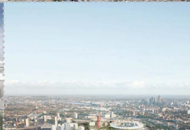
Parc de la ribera del Tàmesi