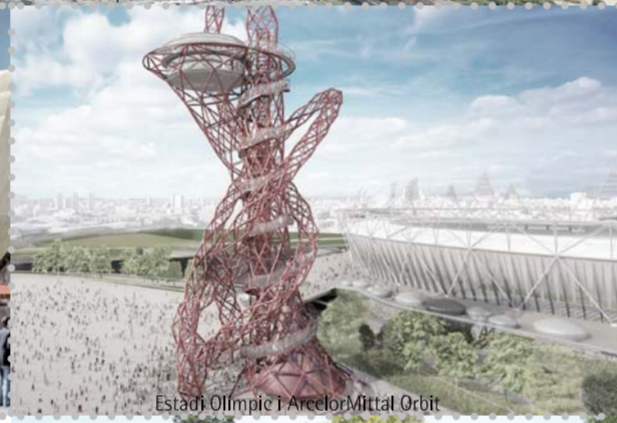
Escultura pública a Stratford East