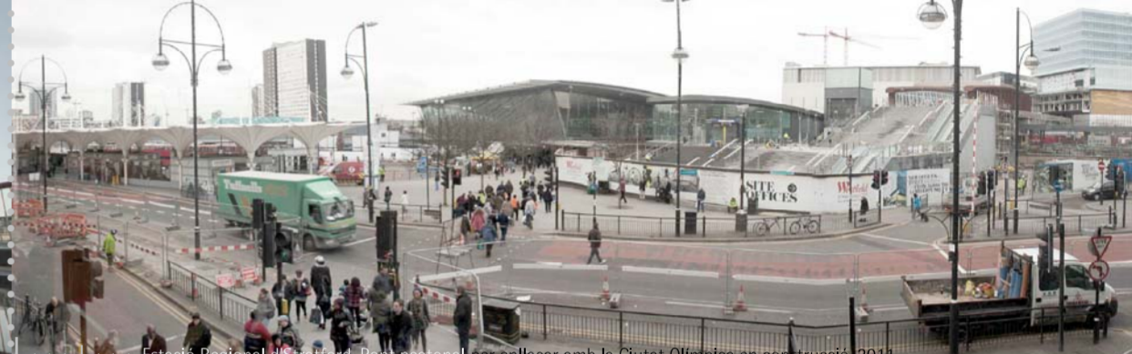
El nou plaçar amb la línia d'Olimpics en construcció 2012