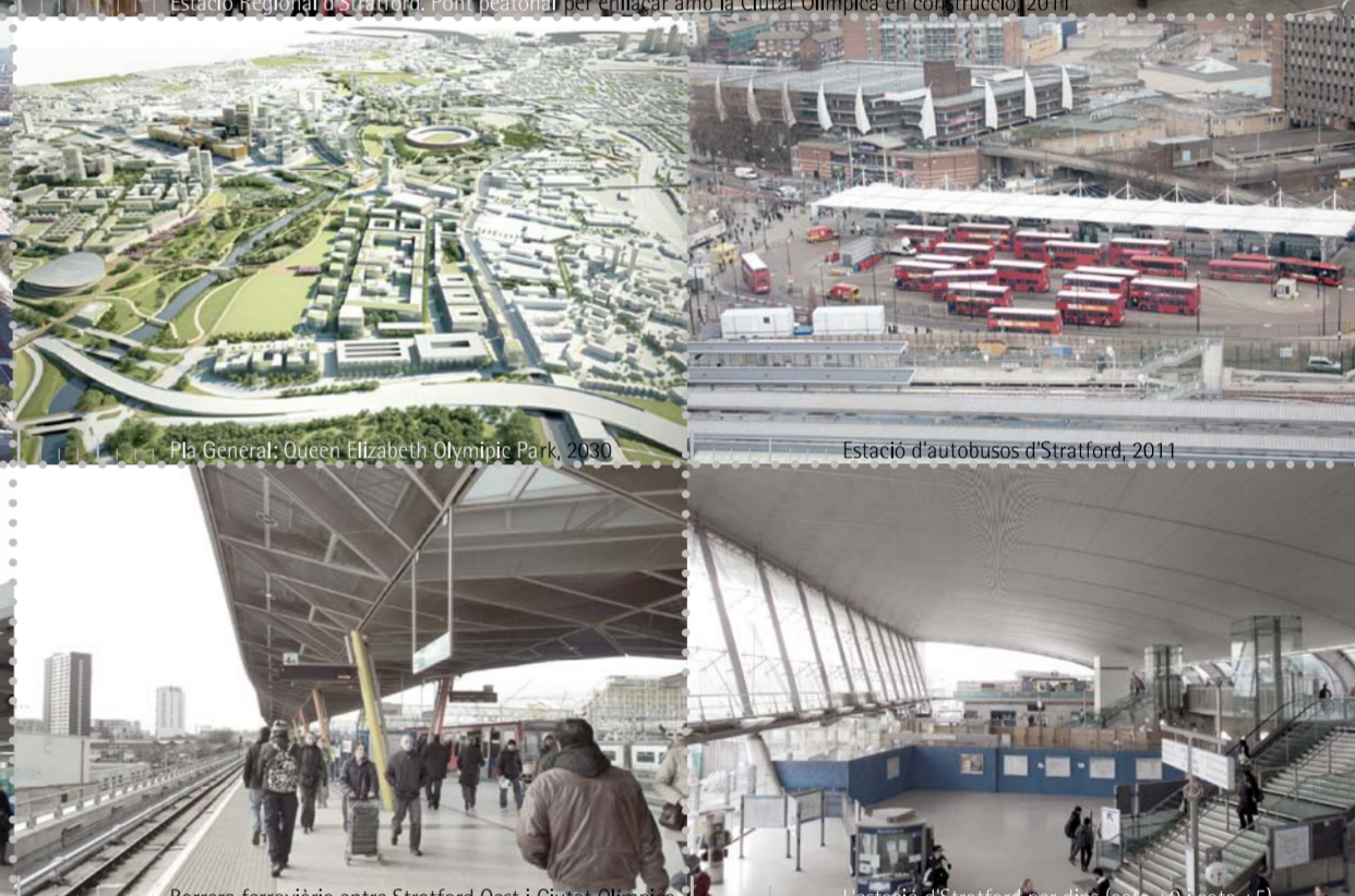
Barana ferroviària entre Stratford East i City of London