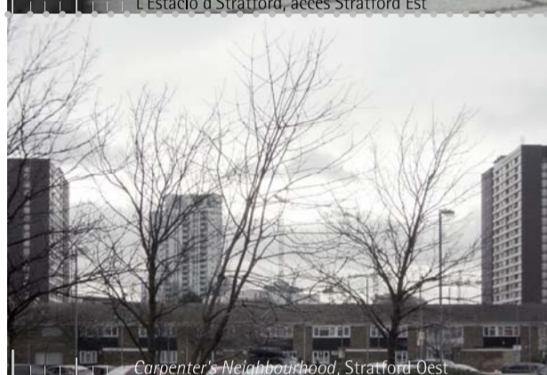
Centre d'activitats i residència a Stratford East