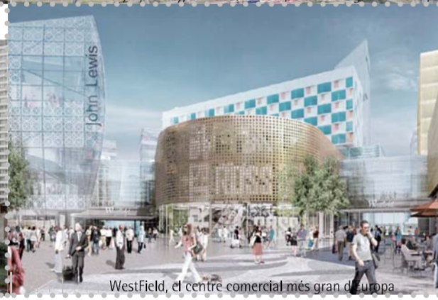
Westfield, el centre comercial més gran