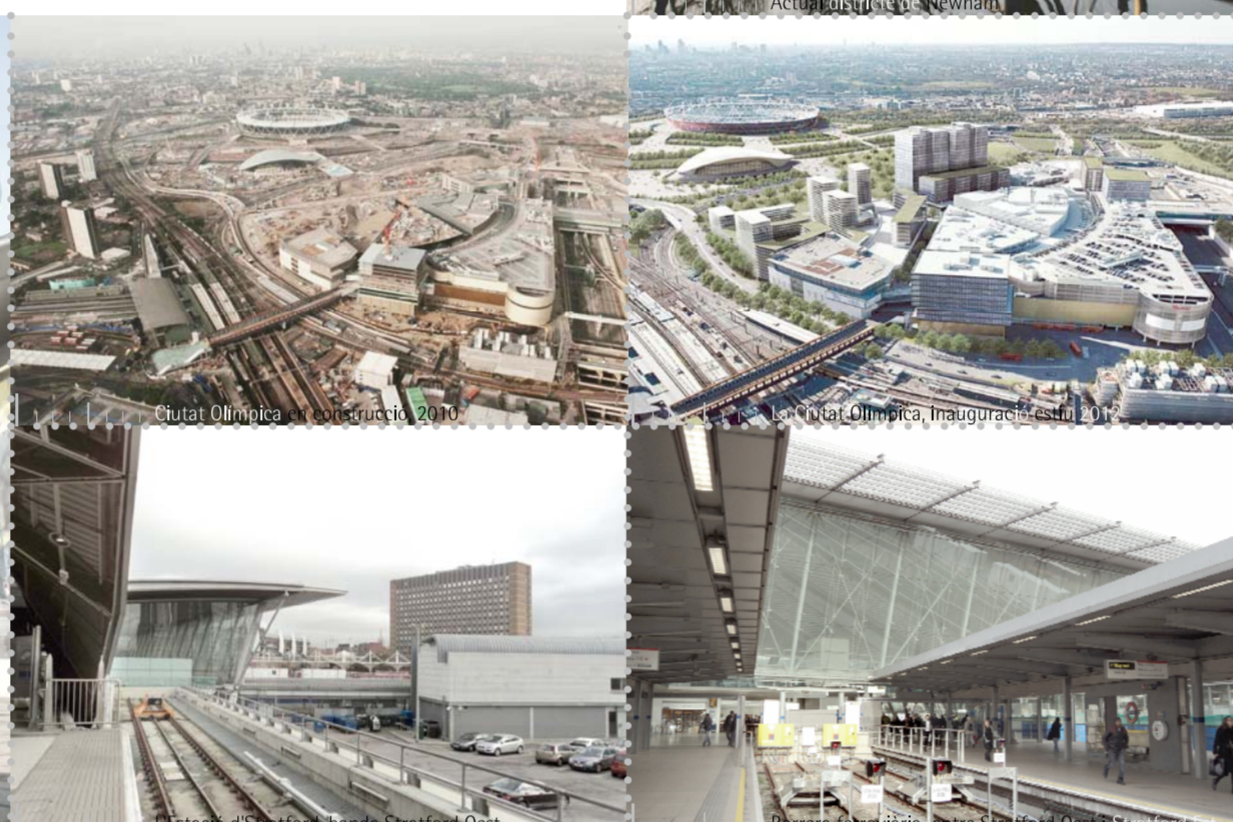
Estació de Stratford i la línia Stratford East