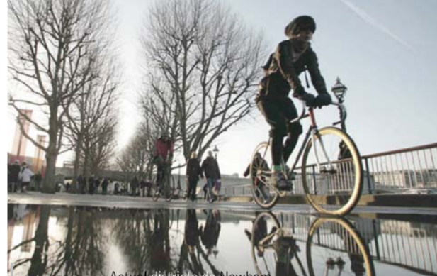
Activitat física i natura