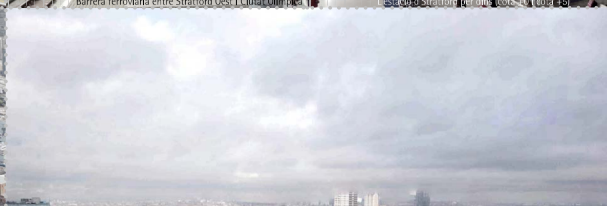
Estació d'autobusos de Stratford, 2011