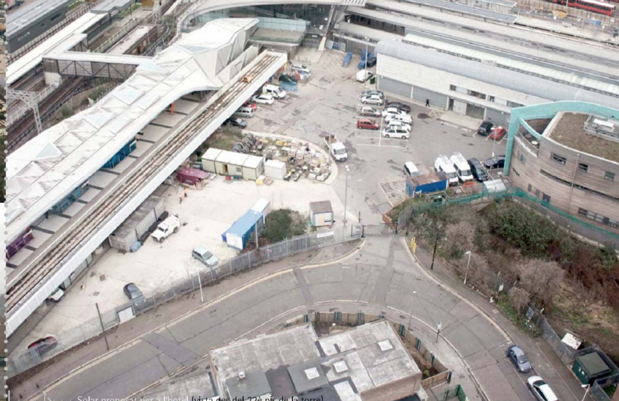
Solar proper per al nou Plaça de 220.000 m² de la línia