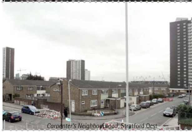
Construcció de nous barris a Stratford East