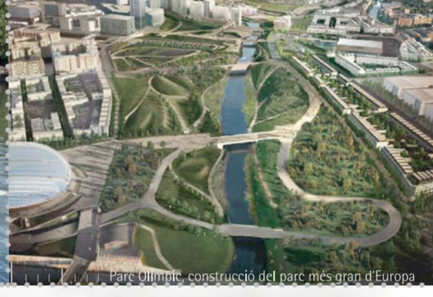
Parc de la ribera del Tàmesi