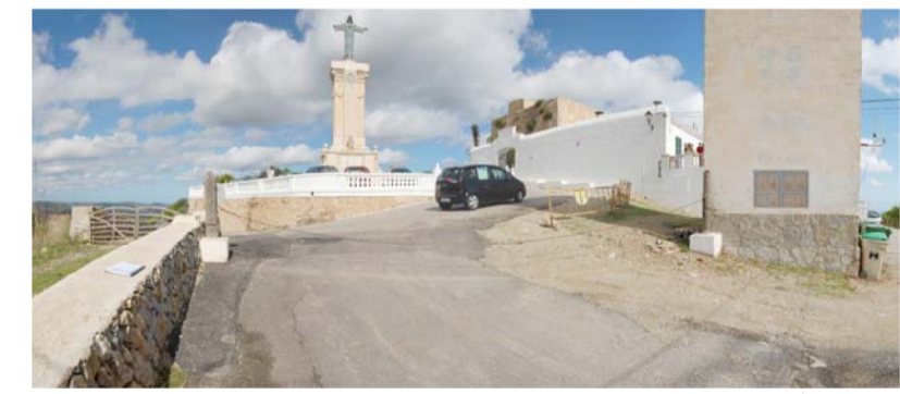
VISTA ACTUAL DE L'ARRIBADA A L'APARCAMENT SOBRE L'ACCÉS AL SANTUARI