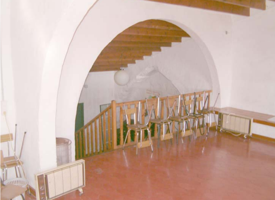
7 - SALA D'ACCÉS AL CONVENT