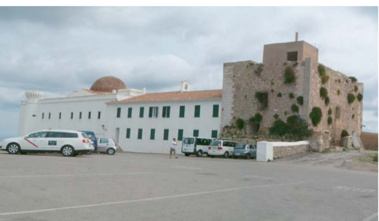
C _ COMPARACIÓ ENTRE EL DIBUX DEL ÀRABIDU D'ÀUSTRIA LLUIS SALVADOR FET ALS ANYS SETANTA DEL SEGLE XIX I LA IMATGE DE L'ESTAT ACTUAL.