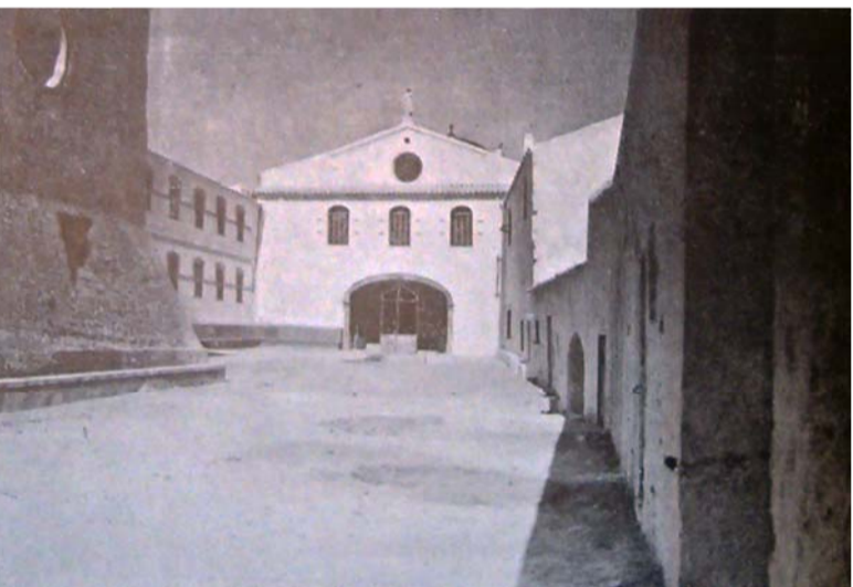
D _ VISTA DE LA REFORMA DEL ATRI DEL TEMPLE DEL 1944.