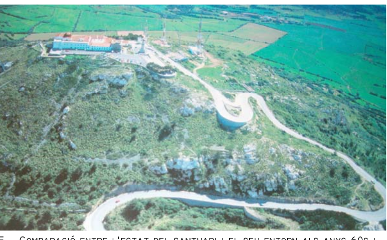
E _ COMPARACIÓ ENTRE L'ESTAT DEL SANTUARI I EL SEU ENTORN ALS ANYS 60S I L'ESTAT ACTUAL.