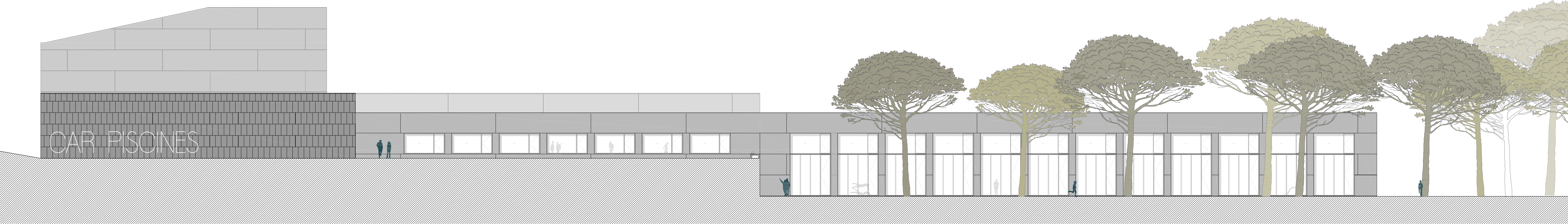
ALÇAT LONGITUDINAL. FAÇANA NORD.