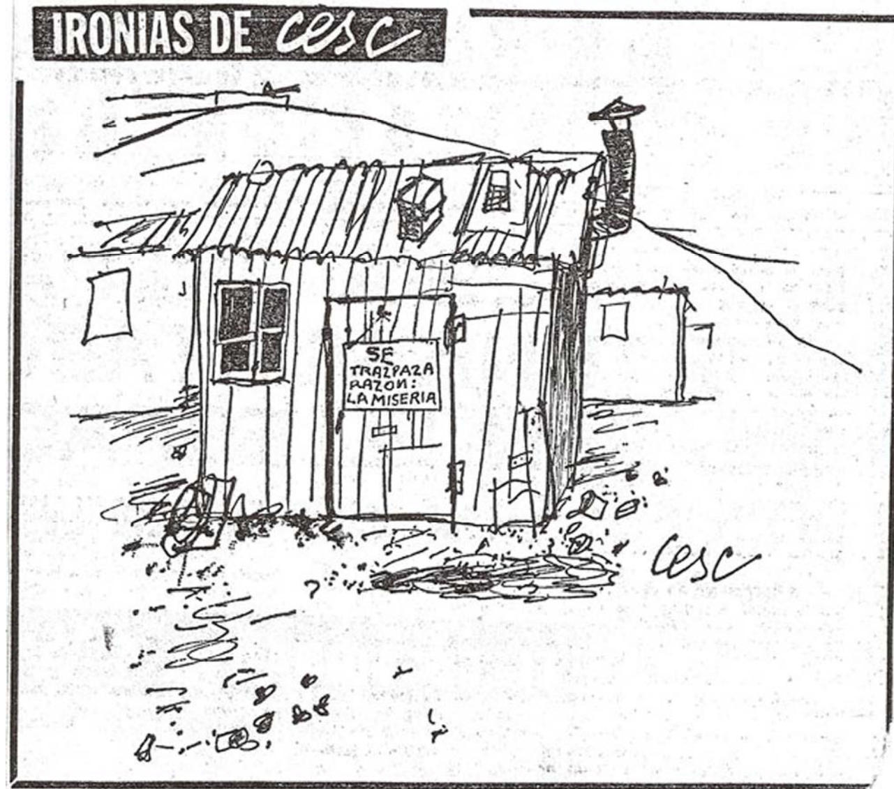
Figura 1.8. El Correo Catalán , 15 de enero de 1969. 31

També és interessant veure com l'estat intenta intervenir en la solució del problema mitjançant la promulgació de lleis, amb els seus respectius Plans.