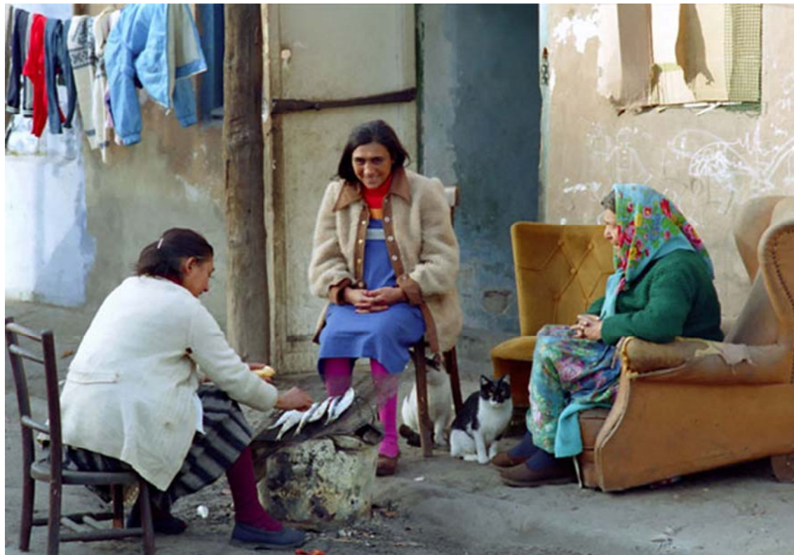
Figura 1.5. Dones al voltant d'un foc cuinant sardines Barcelona, anys vuitanta 23