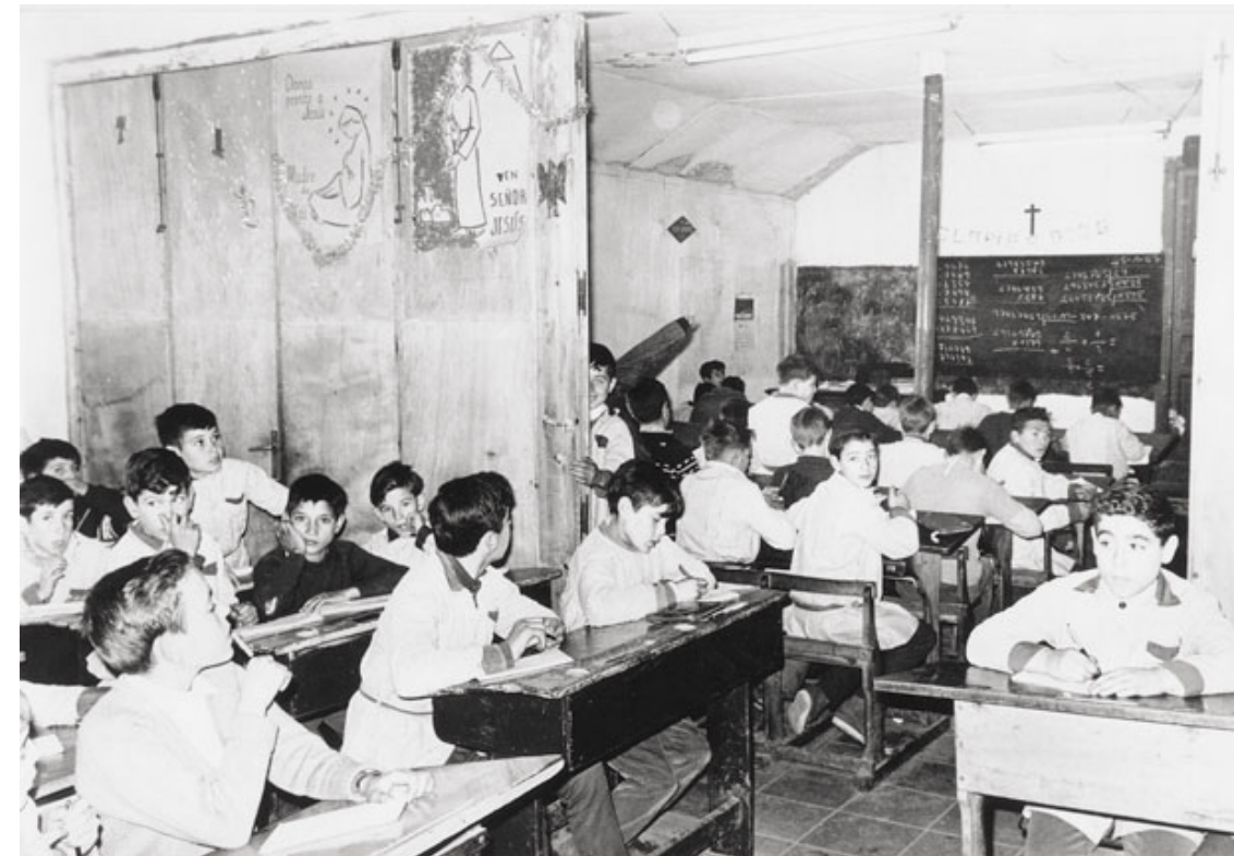
Figura 1.7 Aula de l'escola del Castell, part de l'obra social de l'Escola Pia al Camp de la Bota. Barcelona, 1967.