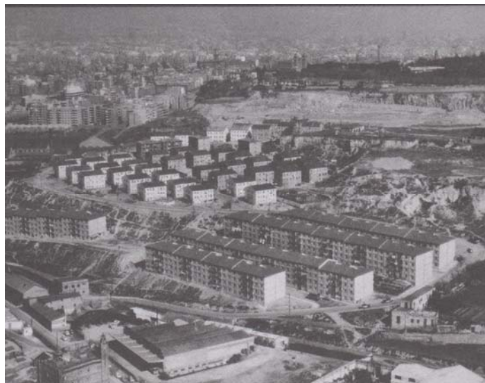
Figura 1.10 El polvorí una de les actuacions que va finalitzar durant aquest període. 38

Tot i les avantatges exposades i el creixement físic de Barcelona durant aquets anys, en el període que ens trobem el podem considerar amb molts casos com una continuació, ja que s'acaben d'executar molts dels grups d'habitatges aprovats en el període anterior com: el Turó de Trinitat, el Polvorí i les cases del Governador a Verdum.