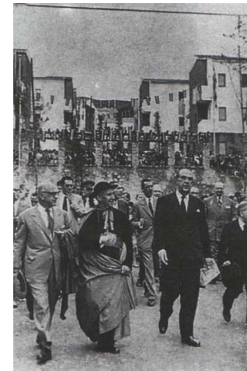
Figura 1.9 Visita de les autoritats, l'any 1951, a Las casas del gobernador a la barriada de Verdum. 37

També el Govern civil amb una actuació ocasional com a organisme promotor va construir el 1951-1952 un polígon de 906 habitatges anomenat Las casas del gobernador a la barriada de Verdum. Són de caràcter provisional, per allotjar famílies que procedeixen de les barraques, funció que compartiran molts grups d'habitatges i polígons d'aquesta època. Aquest fet explicarà també la construcció d'habitatges de reduïdes dimensions i de baixa qualitat de materials.