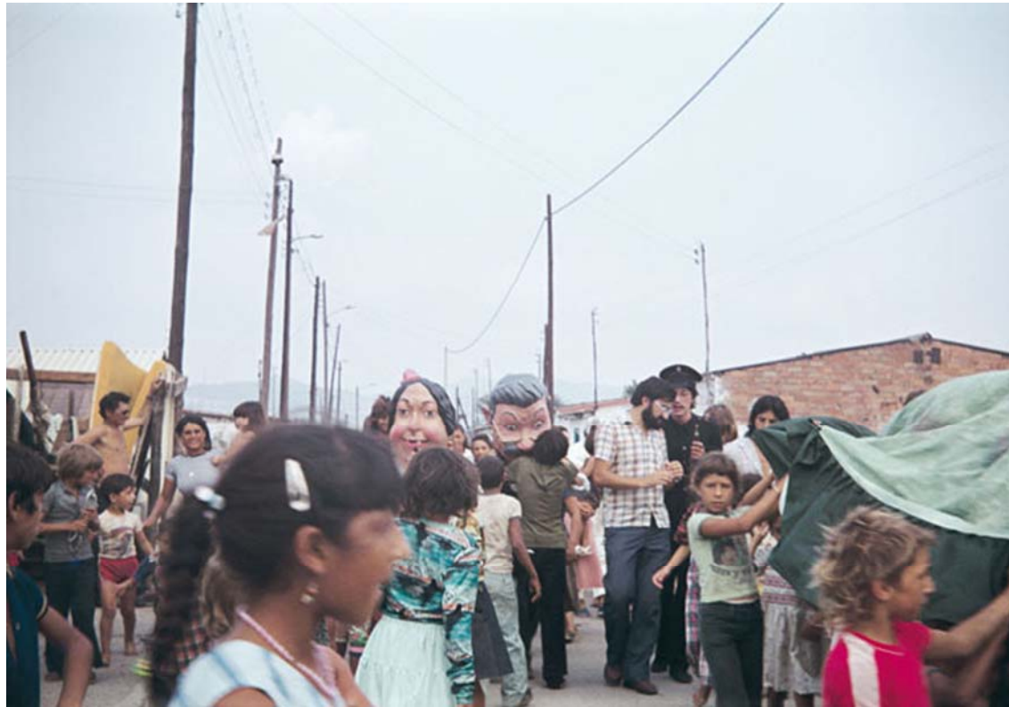
Figura 1.4. Jocs i espectacles infantils al barri de la Perona. Barcelona, any 1981. 22