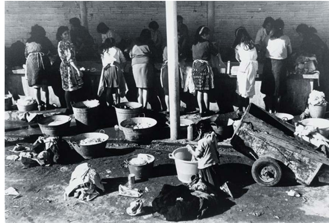
Figura 1.6 Lavadero colectivo instalado por el Ayuntamiento en el Camp de la Bota. Barcelona, 1967. 30

Tot i que fins als anys 70 no comença a desaparèixer, entre els anys del 1961 al 1966, acabaven les obres del polígon Sud Oest del Besos, hi havia els rumors que molts dels habitatges que s'havien construït anaven destinats a allotjar els barraquistes del Camp de Bota. En realitat cap barraquista del Camp de Bota va obtenir un habitatge del polígon construït per el Patronat de l'Habitatge 29 .