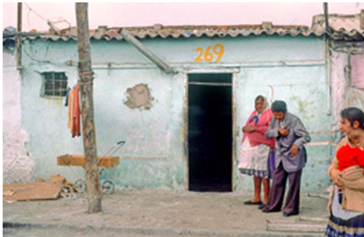
Figura 1.3 Exemple típic d'una barraca 19 En la fotografia podem observar com damunt de la porta de la barraca és troba dibuixat el numero 269. Això era imposat per les autoritats per tal de fer un recompte de les barraques que estaien construïdes, a partir d'aquesta imposició totes les barraques que no estiguessin enumerades s'enderrocaven.