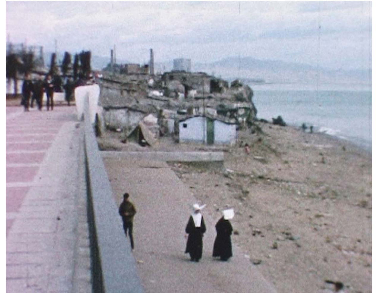
Figura 1.2 Barraques del Somorrostro construïdes a la platja. 18 En la fotografia podem veure a dues monges, cosa habitual en aquets grups de barraques, les quals ajudaven en missió de caritat, ja que, com és de suposar, a n’aquestes zones la pobresa era abundant. També impartien classes en els més petits.

Però no es fins al 1966 quant s’elimina, definitivament, el grup de barraques conegut com a Somorrostro. Això va ser conseqüència de la visita de Franco a Barcelona a causa de unes maniobres militars que incloïen un desembarcament en la zona ocupada per el Somorrostro. Tot i que no quedaven moltes barraques, els seus ocupants van haver de ser rellogats en diferents llocs com: l’Estadi de Montjuic, uns barracons provisionals de Sant Roc... entre ells el nucli de barraques la Perona el qual explicarem a continuació.