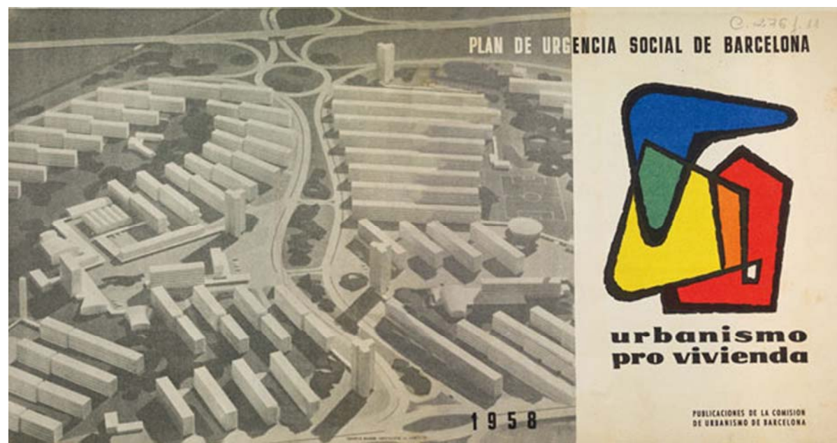
Figura 1.11. Portada de la publicació feta per la Comisión de Urbanismo de Barcelona al 1958, en motiu del Plan de Urgencia Social de Barcelona . 42

La llei va ésser promulgada primer a Madrid al 1957 i posteriorment va ésser aplicada en la seva totalitat a Barcelona al 1958 i seguidament a Biscaia i a Astúries al mateix any.