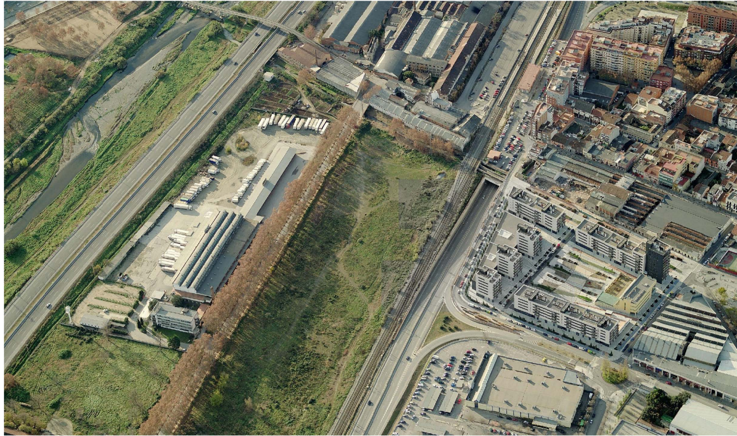
Estado actual del sector de Can Prat y su relación con el centro de Mollet y con el río Besòs