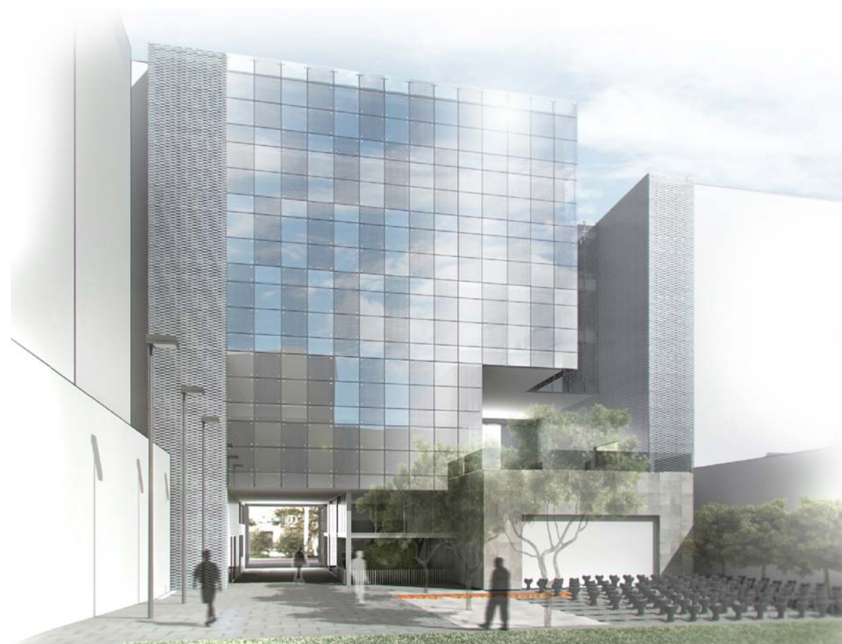
perspectiva pati interior d'illa