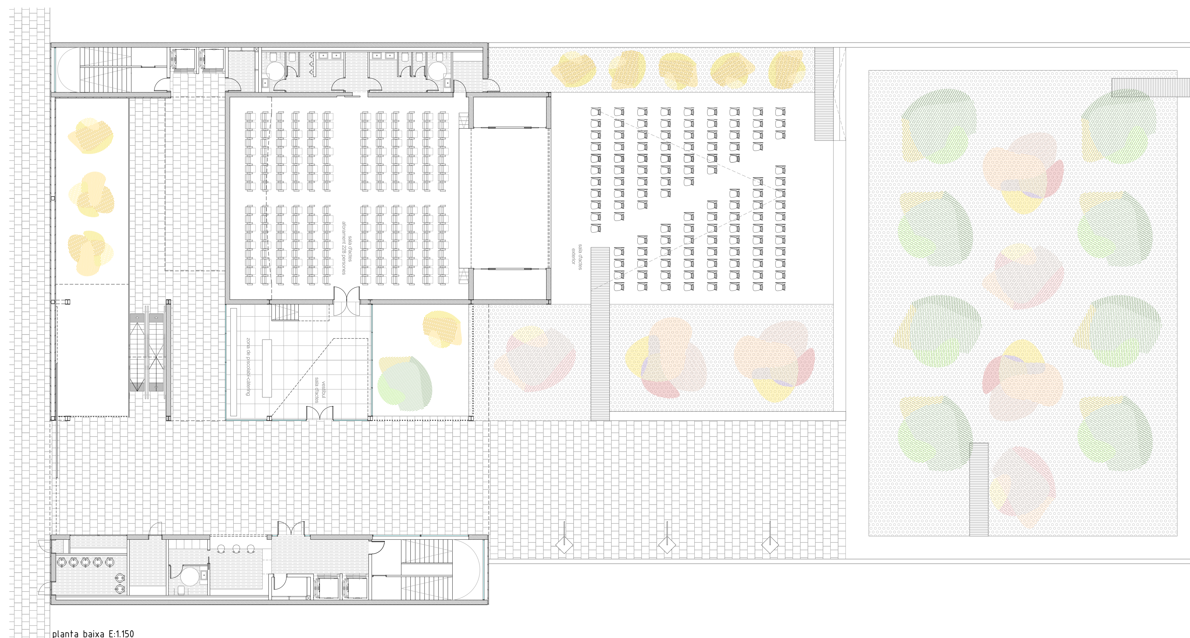
planta baixa E:1.150