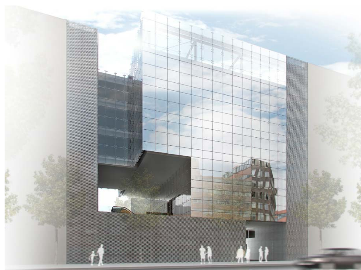
perspectiva c/urgell 145-147