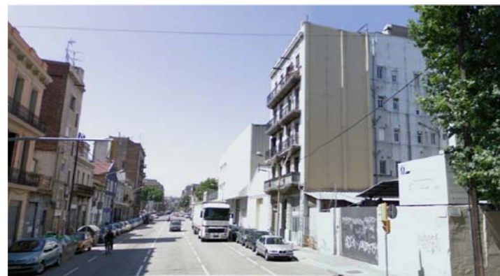
3.- Carrer Pere IV