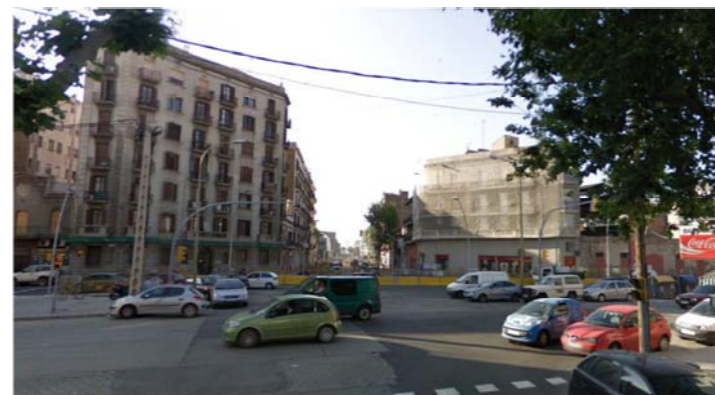
2.- Carrer Badajoz