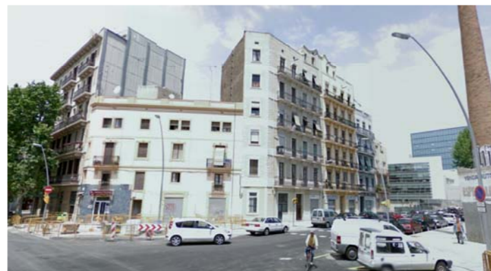
1.- Carrer Ciutat de Granada

Qualificació urbanística: 22@ Activitat 22@: Residència universitària Superfície àmbit projecte: 1.865 m 2 Edificabilitat activitats @: 22 + 0'5 m 2 /m 2 A.R.M.: PB+4 Alineació a vial Amplada carrers: 20 m Pendent aproximat: 0.52% Preexistències: edifici catalogat / protegit