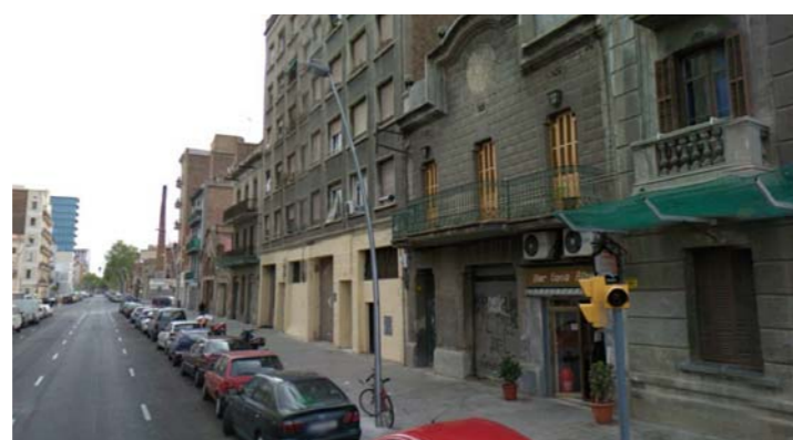
5.- Carrer Pallars

Les alçades de les edificacions de l'entorn són molt variables podent trobar edificis de planta baixa fins a edificis de set plantes.