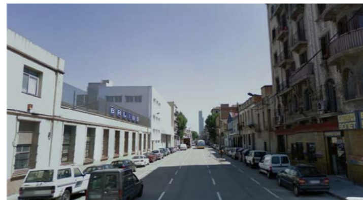
4.- Carrer Pere IV