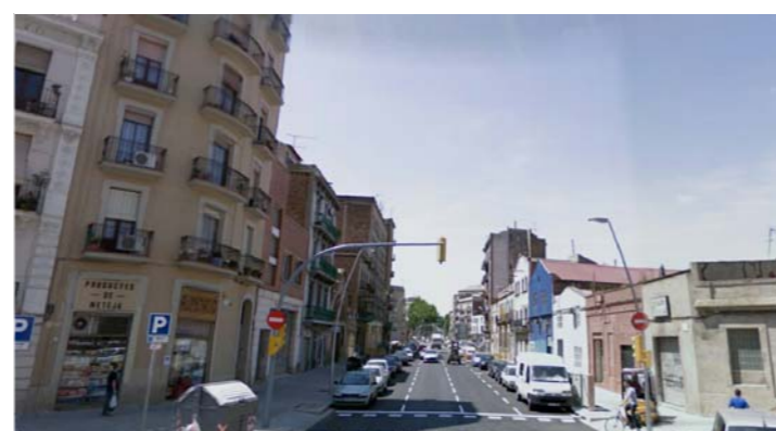
6.- Carrer Pallars